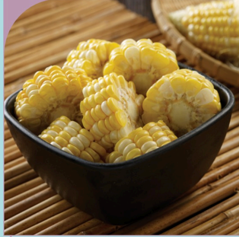
BẮP NGỌT Pearl Sweet Corn

49.000 VND Nửa phần - Half portion 89.000 VND Một phần - Per portion