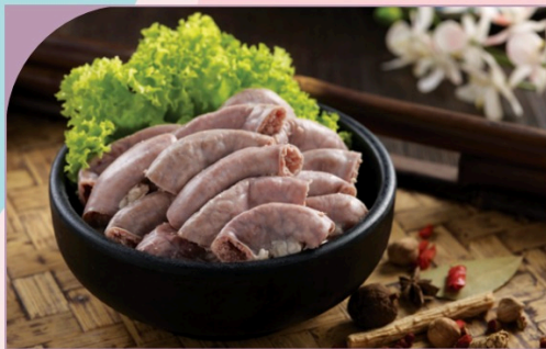
LÒNG HEO Pig's Intestine

99.000 VND Nửa phần - Half portion 189.000 VND Một phần - Per portion