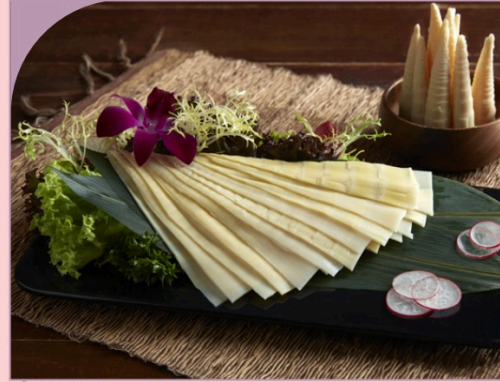
MĂNG TƯƠI NƯỚC NGỌT Fresh Water Bamboo Shoots