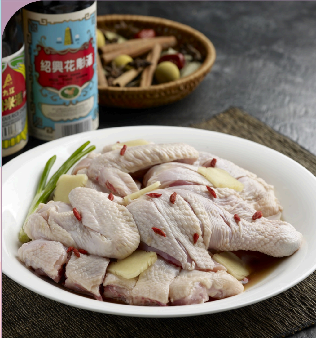
GÀ NGÂM RƯỢU KAMPONG Chinese Wine Kampong Chicken