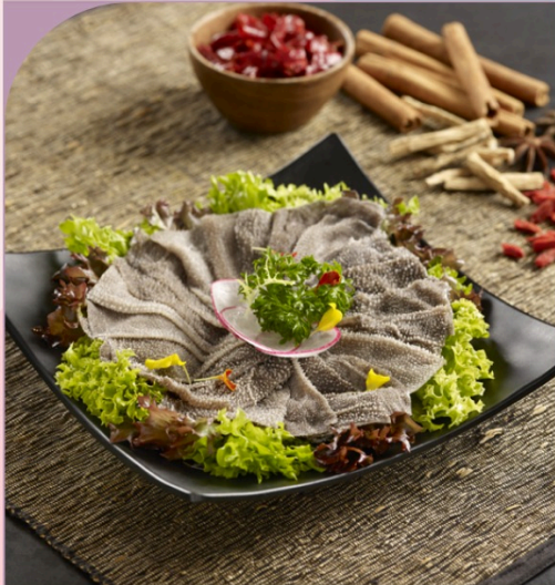
LÁ SÁCH THIÊN TĂNG Black Cow Tripe