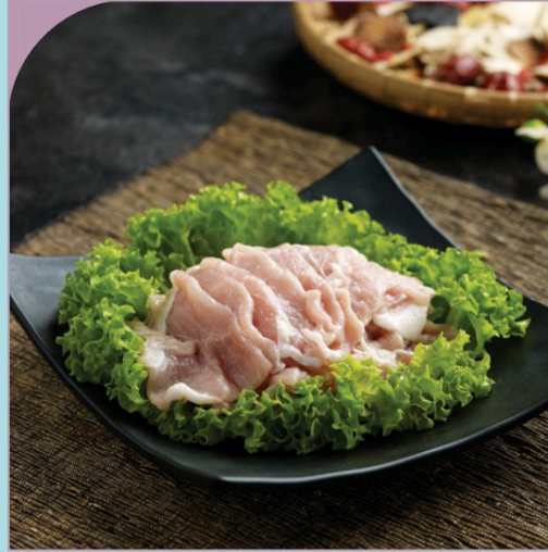
THÂN HEO THÁI LÁT Tender Slided Pork

179.000 VND Nửa phần - Half portion 349.000 VND Một phần - Per portion