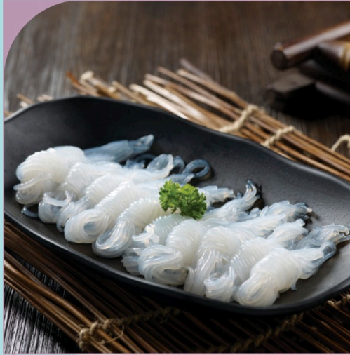
MIẾN NUA Crystal Vermicelli

99.000 VND Nửa phần - Half portion 189.000 VND Một phần - Per portion