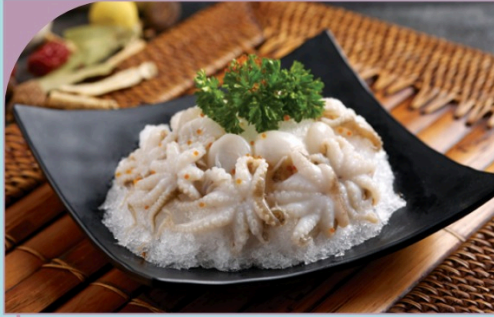
BẠCH TUỘT BABY Baby Octopus

99.000 VND Nửa phần - Half portion 189.000 VND Một phần - Per portion