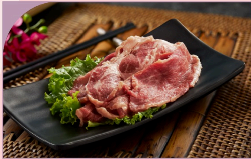
THỊT HEO IBERICO MỀM Tender Iberico Pork

89.000 VND Nửa phần - Half portion 169.000 VND Một phần - Per portion