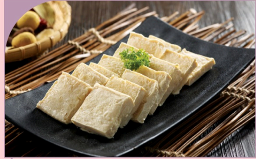
ĐẬU PHỤ ĐÁ Iced Tofu

29.000 VND Nửa phần - Half portion 49.000 VND Một phần - Per portion