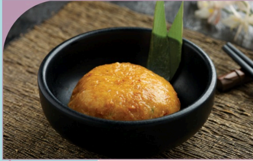
CHÀ CÁ OTAK-OTAK Otak-otak Fish Paste