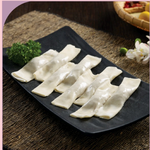
SÙI CẢO THỊT HEO CUỘN Pork Roll Dumpling

99.000 VND Nửa phần - Half portion 189.000 VND Một phần - Per portion