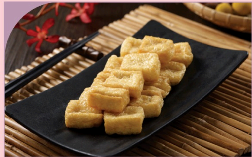
ĐẬU PHỤ CHIÊN Tofu Puff

29.000 VND Nửa phần - Half portion 49.000 VND Một phần - Per portion