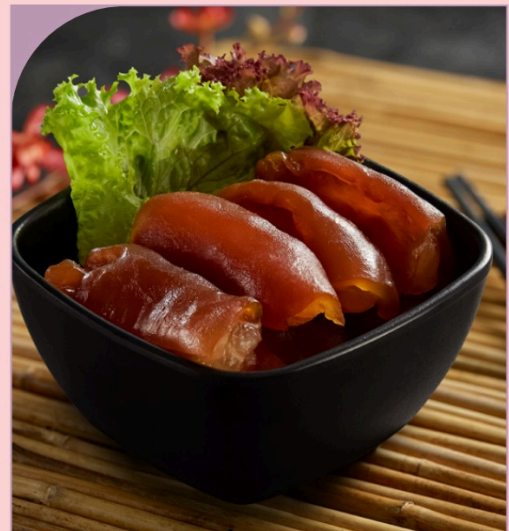
GÂN BÒ Beef Tendon

109.000 VND Nửa phần - Half portion 209.000 VND Một phần - Per portion