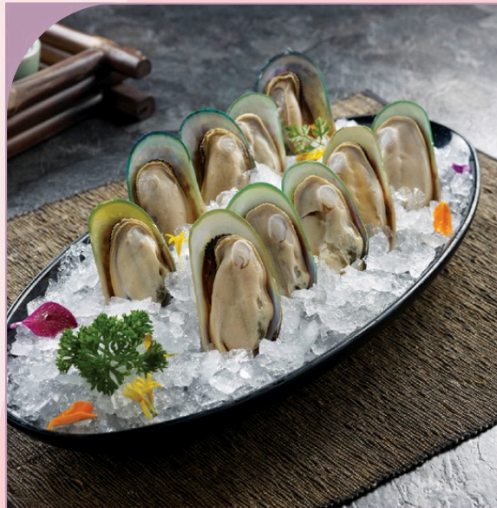
VẸM XANH NEW ZEALAND Green Mussel New Zealand

99.000 VND Nửa phần - Half portion 189.000 VND Một phần - Per portion