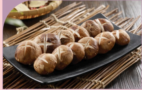
NẤM HƯƠNG TƯƠI Fresh Mushroom