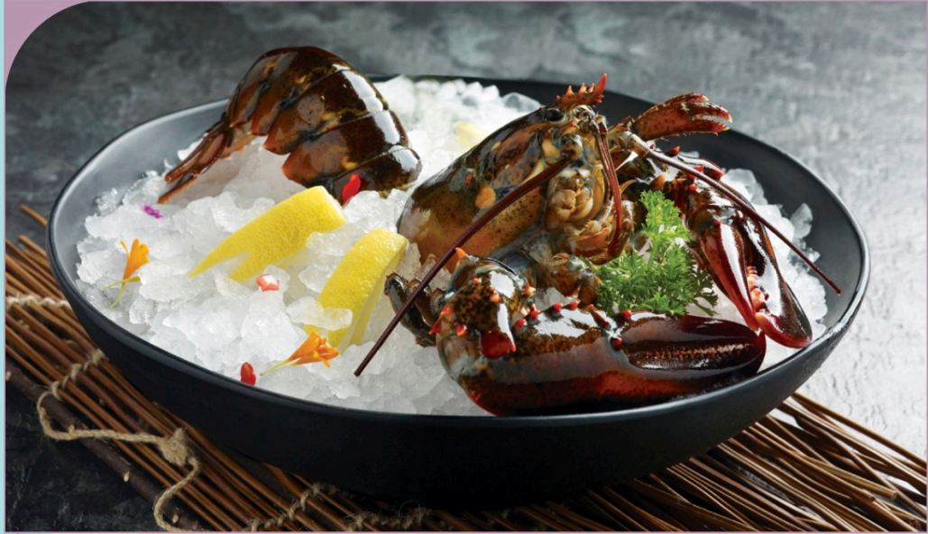
TÔM HŨM BOSTON Boston Lobster