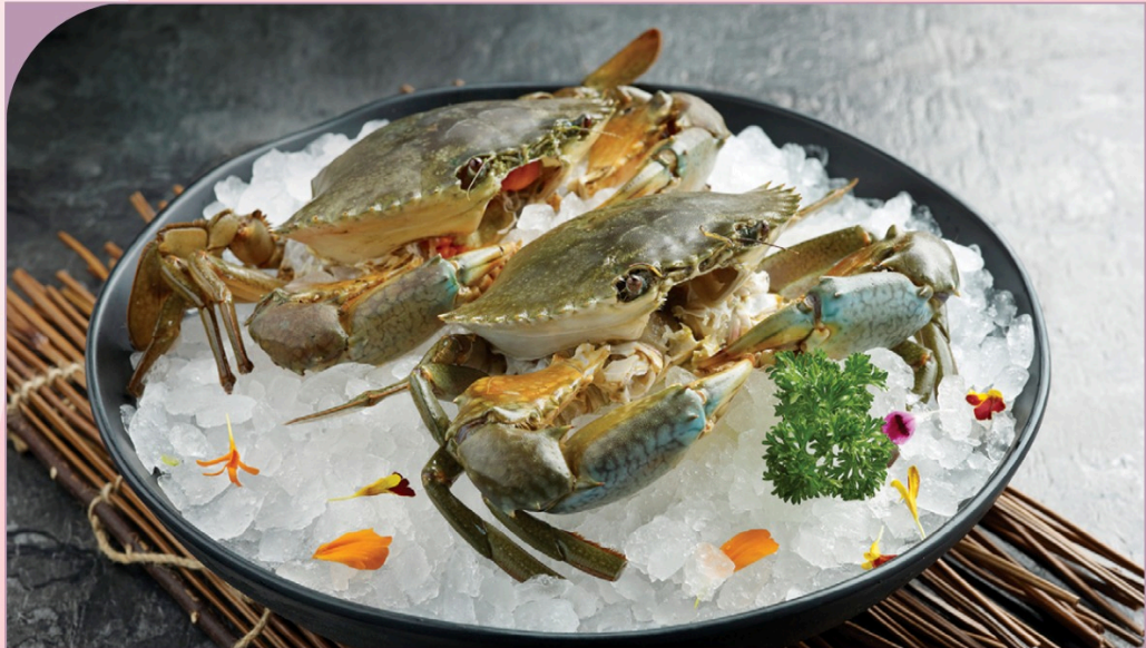
CUA SỐNG Live Crab