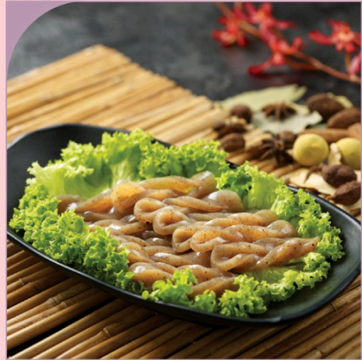
BÚN NUA Shredded Konnyahu

99.000 VND Nửa phần - Half portion 189.000 VND Một phần - Per portion