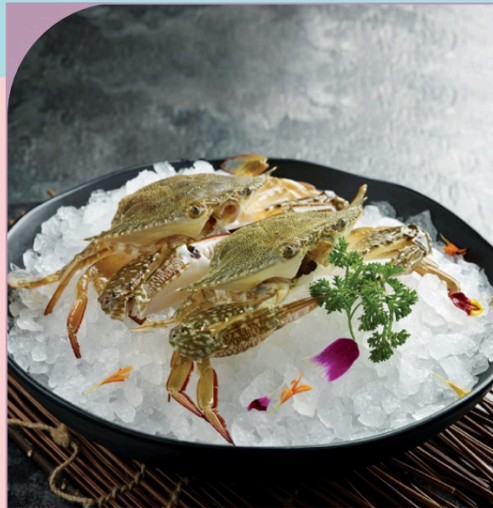
GHẸ BÔNG Fresh Flower Crab

389.000 VND Nửa phần - Half portion 769.000 VND Một phần - Per portion