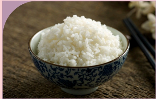
CƠM TRẮNG Rice