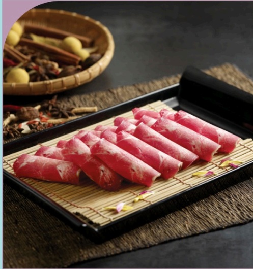
LƯỠI BÒ Ox's Tongue

99.000 VND Nửa phần - Half portion 189.000 VND Một phần - Per portion