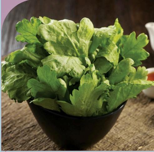
TẦN Ô Tang O

49.000 VND Nửa phần - Half portion 89.000 VND Một phần - Per portion