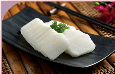
CẢI TRẮNG White Radish

30.000 VND Nửa phần - Half portion 60.000 VND Một phần - Per portion