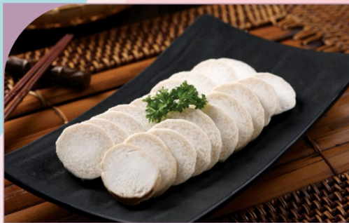
NẤM ĐŨI GÀ Drumstick Mushroom