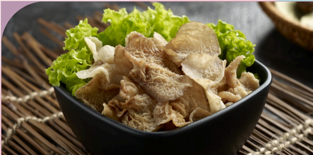
NẤM BỤNG ĐẸ Morel Ear Mushroom