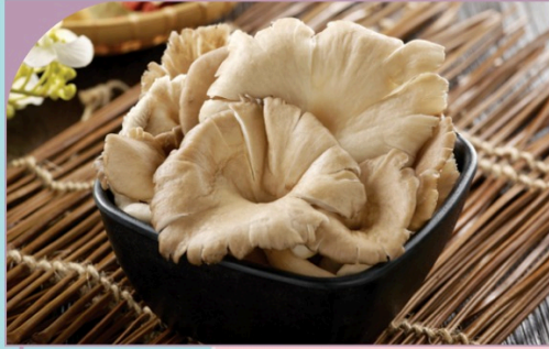
NẤM BÀO NGƯ Abalone Mushroom