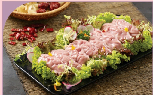
ÓC HEO Pig's Brain

79.000 VND Nửa phần - Half portion 149.000 VND Một phần - Per portion