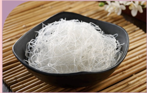
BÚN TÀU Glass Noodle

59.000 VND Nửa phần - Half portion 109.000 VND Một phần - Per portion