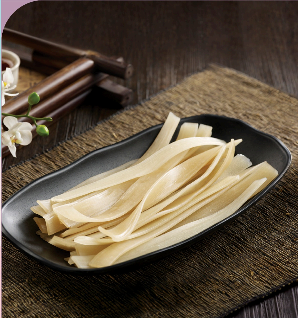
MIẾN KHOAI (SỢI TO) Potato Wide Vermicelli