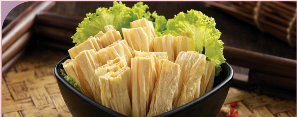
PHÙ TRÚC KHÔ Dried Beancurd Stick

29.000 VND Nửa phần - Half portion 49.000 VND Một phần - Per portion