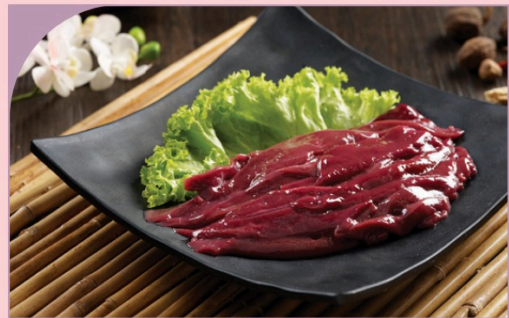
GAN HEO Pig's Liver

89.000 VND Nửa phần - Half portion 169.000 VND Một phần - Per portion