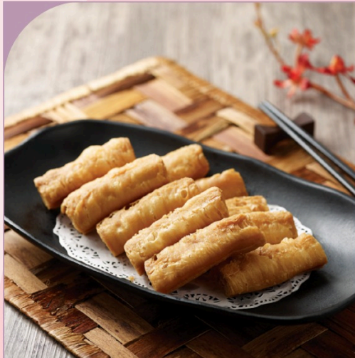
QUẢY CHIÊN GIÒN Fried Dough Stick

59.000 VND Nửa phần - Half portion 109.000 VND Một phần - Per portion