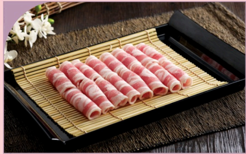
THỊT BA CHỈ HEO THÁI LÁT Sliced Pork Belly

79.000 VND Nửa phần - Half portion 149.000 VND Một phần - Per portion