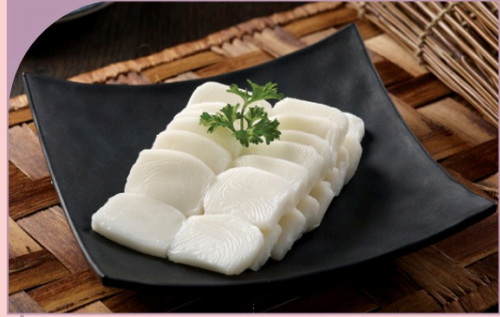
BÁNH GẠO Rice Cake

49.000 VND Nửa phần - Half portion 89.000 VND Một phần - Per portion