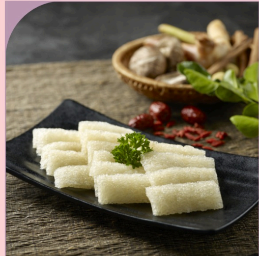
DA HEO CHIÊN GIÒN Fried Pig's Skin

39.000 VND Nửa phần - Half portion 69.000 VND Một phần - Per portion