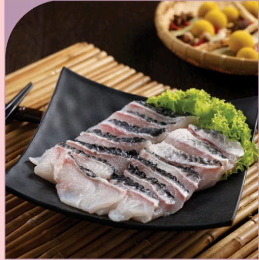
CÁ LÓC BÔNG THÁI LÁT Sliced Toman Fish

149.000 VND Nửa phần - Half portion 289.000 VND Một phần - Per portion