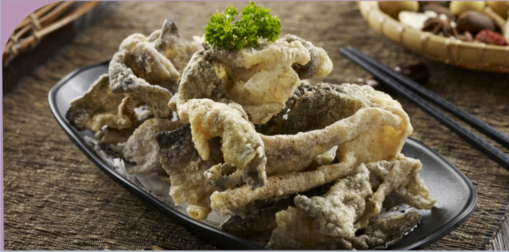
DA CÁ CHIÊN GIÒN Fried Fish Skin