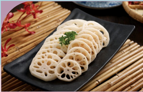
CỦ SEN THÁI LÁT Sliced Lotus Root

29.000 VND Nửa phần - Half portion 49.000 VND Một phần - Per portion