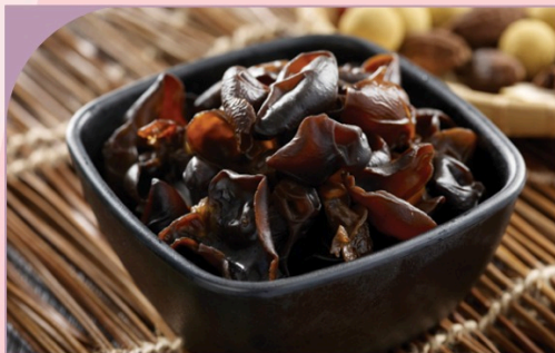
MỘC NHĨ Black Fungus