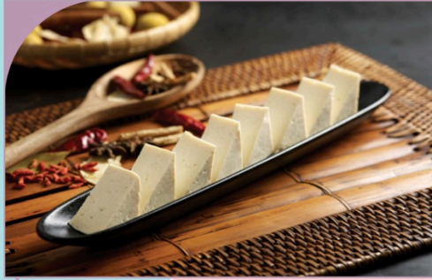
ĐẬU PHỤ Firm Tofu

29.000 VND Nửa phần - Half portion 49.000 VND Một phần - Per portion