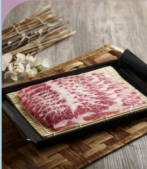
SƯỜN BÒ ANGUS ỨC RÚT XƯƠNG AUS Angus Boneless Short Rib