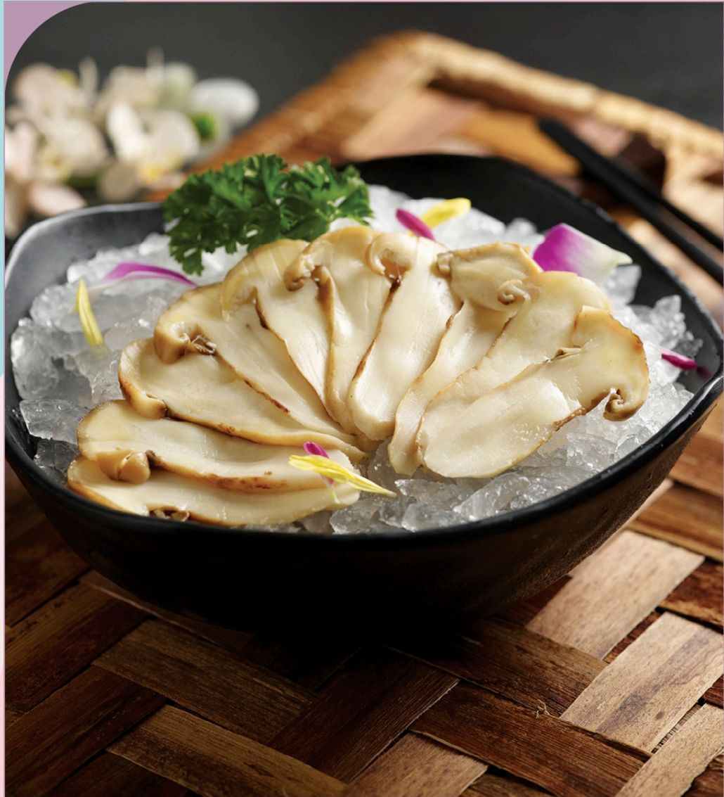
NẤM THÔNG White Pine Mushroom