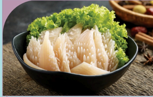
MỰC NANG Fresh Cuttlefish

99.000 VND Nửa phần - Half portion 189.000 VND Một phần - Per portion