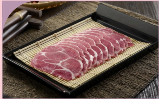
THỊT CỔ HEO BRAZIL THÁI LÁT Sliced Pork Collar Brazil

219.000 VND Nửa phần - Half portion 429.000 VND Một phần - Per portion