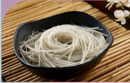
MIẾN KHOAI (SỢI NHỎ) Potato Thin Vermicelli

49.000 VND Nửa phần - Half portion 89.000 VND Một phần - Per portion