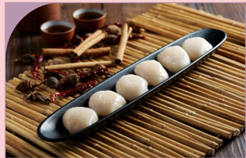
SÒ ĐIẾP HOKKAIDO Hokkaido Fresh Scallop

590.000 VND Nửa phần - Half portion 1.090.000 VND Một phần - Per portion