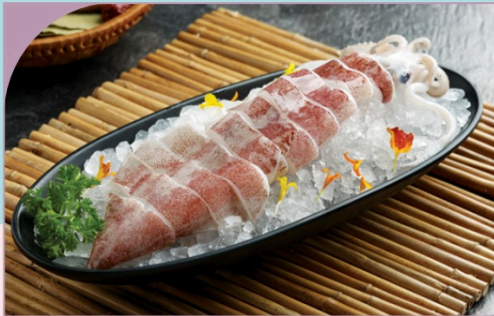
MỰC ỐNG Squid Ring

109.000 VND Nửa phần - Half portion 209.000 VND Một phần - Per portion