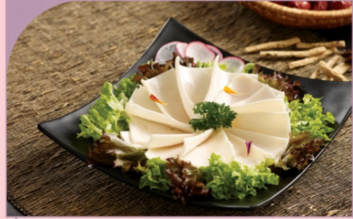
CUÔNG TIM HEO Pig's Aorta

79.000 VND Nửa phần - Half portion 149.000 VND Một phần - Per portion