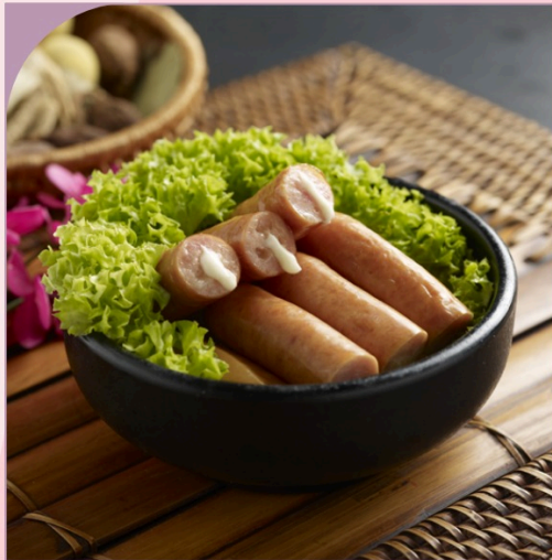
XÚC XÍCH GÀ PHÔ MAI Cheesy Chicken Sausage

59.000 VND Nửa phần - Half portion 109.000 VND Một phần - Per portion