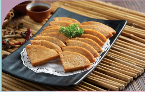
HEO LUNCHEON CHIÊN GIÒN Crispy Luncheon Meat

79.000 VND Nửa phần - Half portion 149.000 VND Một phần - Per portion