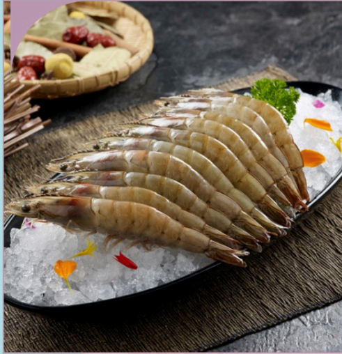
TÒM THẺ White Legs Prawn

149.000 VND Nửa phần - Half portion 289.000 VND Một phần - Per portion