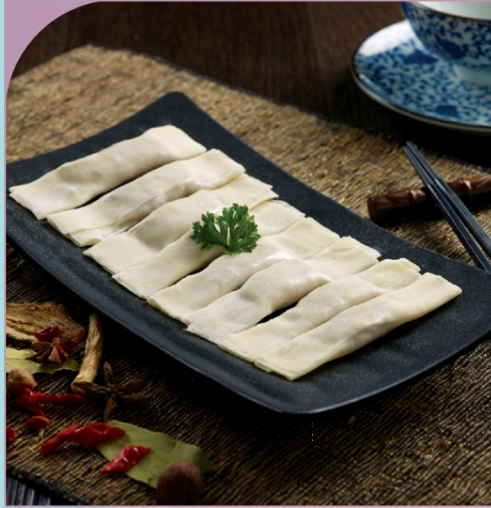
SÙI CẢO TÔM CUỘN Prawn Roll Dumpling

89.000 VND Nửa phần - Half portion 169.000 VND Một phần - Per portion