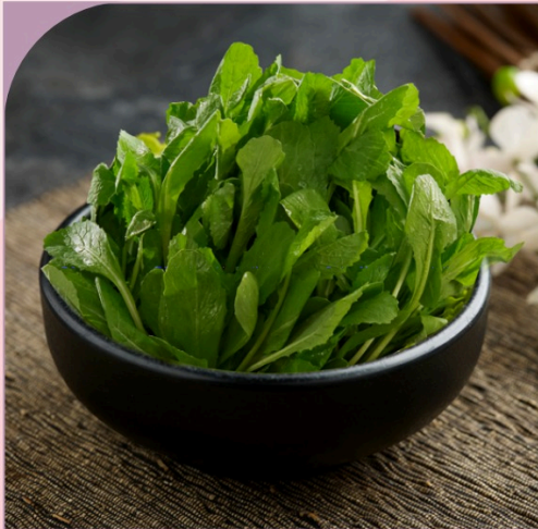
CẢI BÈ XANH BABY Baby Mustard Greens

39.000 VND Nửa phần - Half portion 69.000 VND Một phần - Per portion