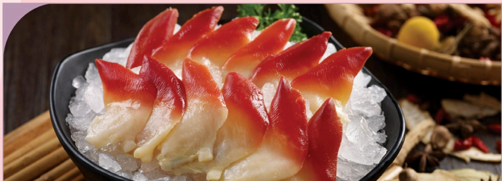
SÒ ĐỎ Red Clam

209.000 VND Nửa phần - Half portion 409.000 VND Một phần - Per portion