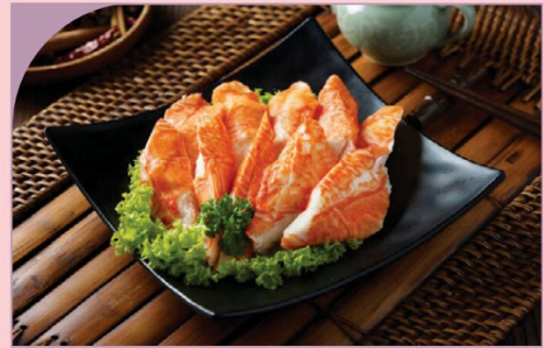
THANH CUA ALASKA Alaska Crab Stick

59.000 VND Nửa phần - Half portion 109.000 VND Một phần - Per portion