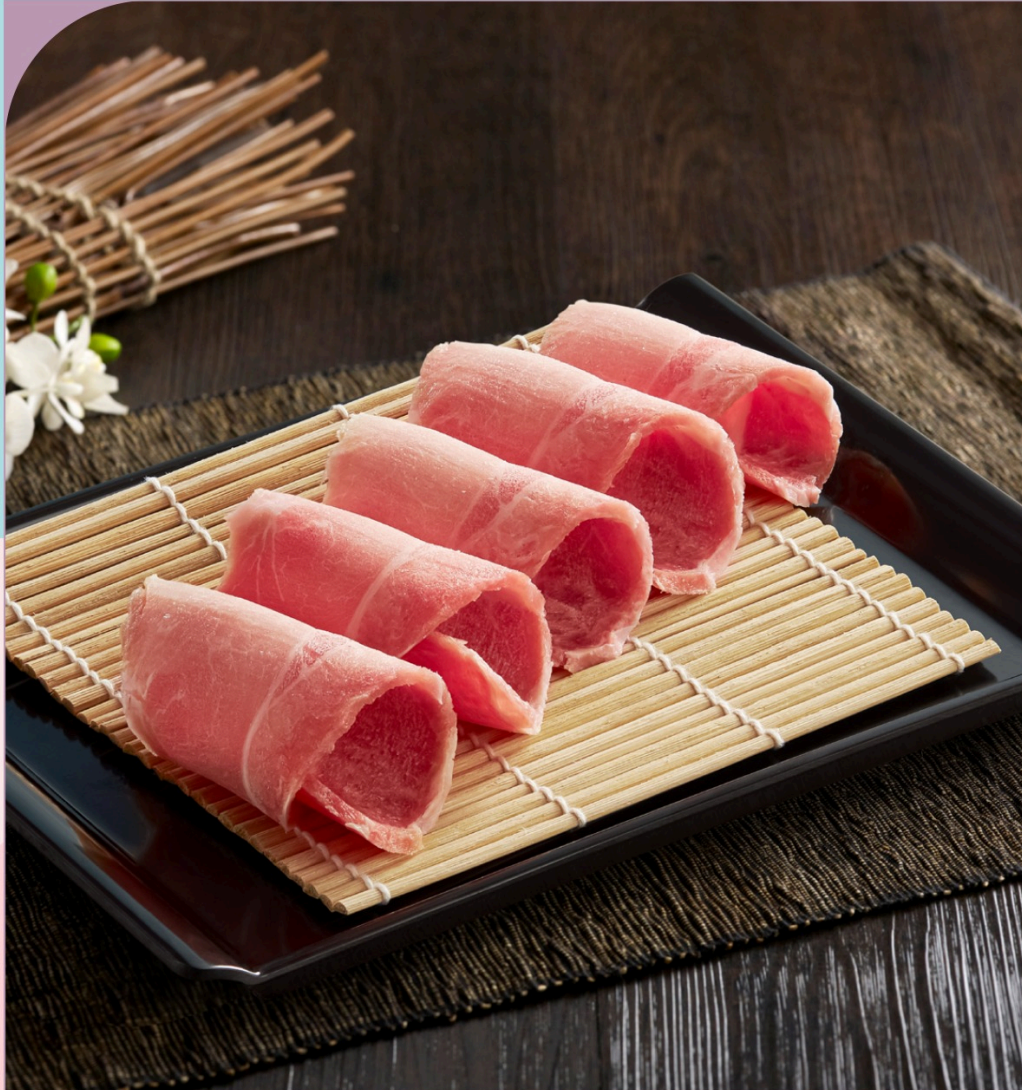
THỊT CỎ HEO IBERICO Iberico Pork Collar