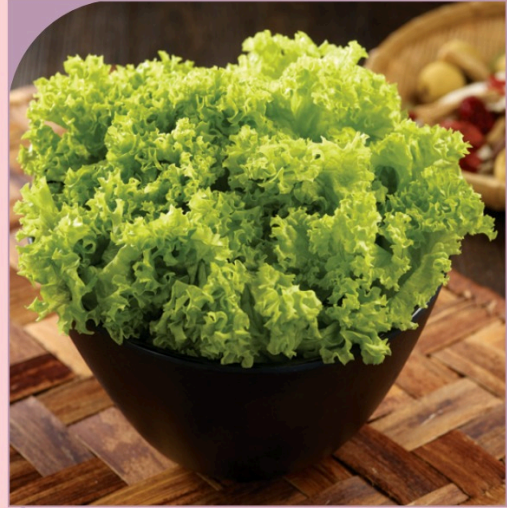
XÀ LÁCH Lettuce

39.000 VND Nửa phần - Half portion 69.000 VND Một phần - Per portion