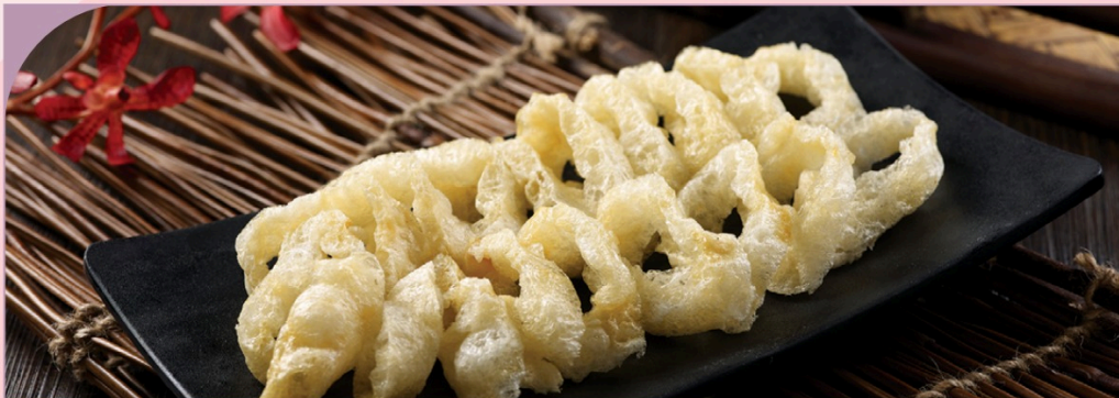
BONG BÓNG CÁ KHÔ Dried Fish Maw

109.000 VND Nửa phần - Half portion 209.000 VND Một phần - Per portion