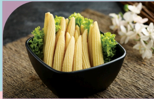
BẮP NON Baby Corn

49.000 VND Nửa phần - Half portion 89.000 VND Một phần - Per portion