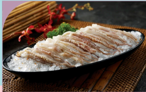
RÂU BẠCH TUỘT Fresh Octopus Tentacle

209.000 VND Nửa phần - Half portion 409.000 VND Một phần - Per portion