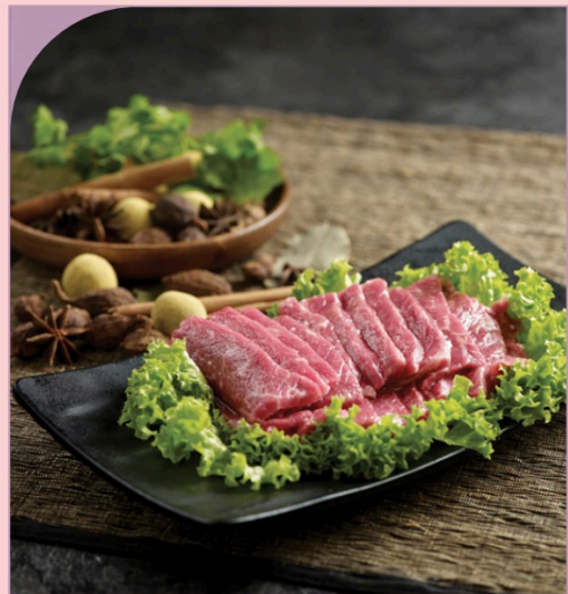
THĂN BÒ THÁI LÁT Tender Sliced Beef