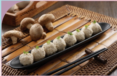
HEO VIÊN TIÊU ĐEN Black Pepper Pork Meat Ball

89.000 VND Nửa phần - Half portion 169.000 VND Một phần - Per portion