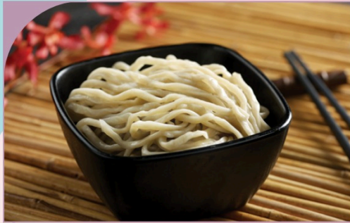
MÌ UDON Handmade Udon Noodle

49.000 VND Nửa phần - Half portion 89.000 VND Một phần - Per portion