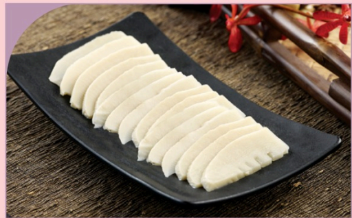
MĂNG Bamboo Shoot

49.000 VND Nửa phần - Half portion 89.000 VND Một phần - Per portion