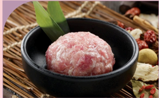
CHÀ HEO BÂM Pork Paste