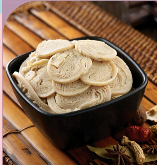
LÁ SÁCH TRẮNG Beef Tripe