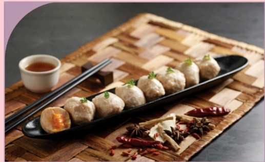
GÀ VIÊN PHÔ MAI Cheesy chicken ball

99.000 VND Nửa phần - Half portion 189.000 VND Một phần - Per portion