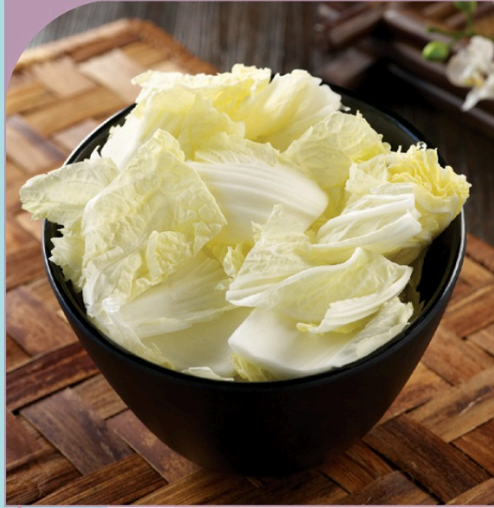
CẢI THẢO Chinese Cabbage

39.000 VND Nửa phần - Half portion 69.000 VND Một phần - Per portion