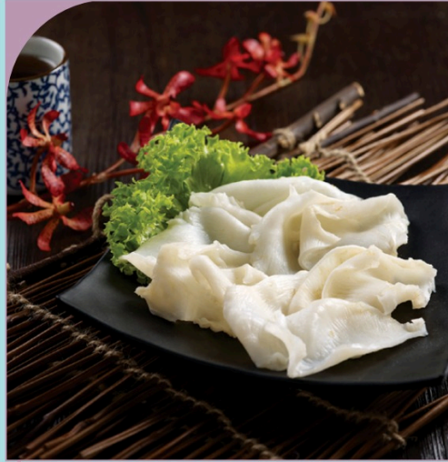
BONG BÔNG CÁ Fish Maw

389.000 VND Nửa phần - Half portion 769.000 VND Một phần - Per portion