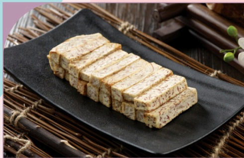
KHOAI MỠN CHIÊN Golden Taro

49.000 VND Nửa phần - Half portion 89.000 VND Một phần - Per portion