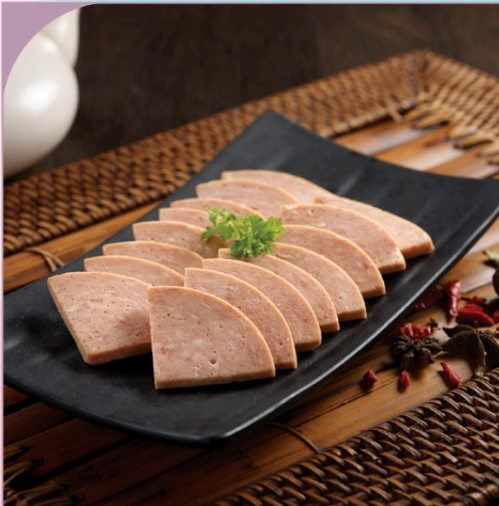
THỊT HEO LUNCHEON Luncheon Meat

79.000 VND Nửa phần - Half portion 149.000 VND Một phần - Per portion