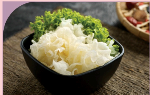
NẤM TUYẾT Snow Fungus