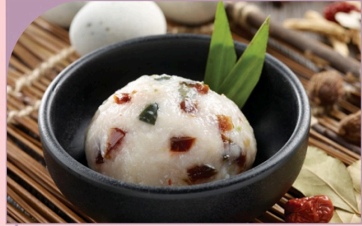
CHÀ CÁ TRỨNG BÁCH THẢO Century egg fish paste