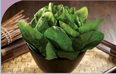
CẢI BÓ XÔI Spinach

35.000 VND Nửa phần - Half portion 70.000 VND Một phần - Per portion