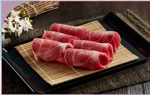
THỊT CỔ HEO BRAZIL Brazil Pork Collar

89.000 VND Nửa phần - Half portion 169.000 VND Một phần - Per portion