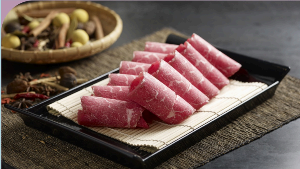
THỊT NẠC VAI MỸ THÁI LÁT Chuck Eye Log (USDA)