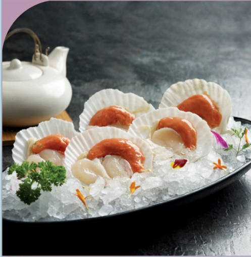
SÒ ĐIẾP TƯƠI Fresh Scallop

389.000 VND Nửa phần - Half portion 769.000 VND Một phần - Per portion