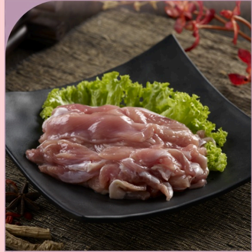
ĐÙI GÀ THÁI LÁT Sliced Chicken Thigh

59.000 VND Nửa phần - Half portion 109.000 VND Một phần - Per portion