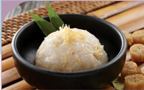
CHÀ CÁ SÒ ĐIỆP Dried Scallop Fish Paste