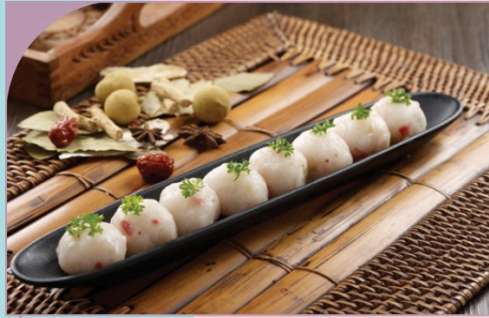
CÁ VIÊN TRIỀU CHÂU Teochew style fish ball

79.000 VND Nửa phần - Half portion 149.000 VND Một phần - Per portion