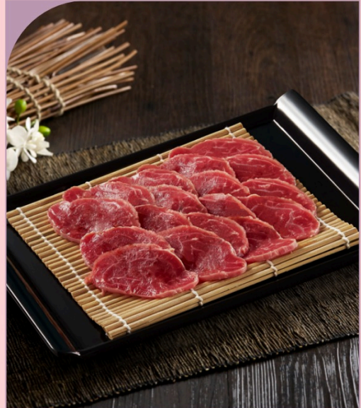
BẮP LỖI RỪA Heel Muscle Beef