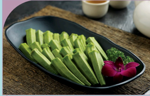
SPINACH Baby Lady's Finger

35.000 VND Nửa phần - Half portion 70.000 VND Một phần - Per portion