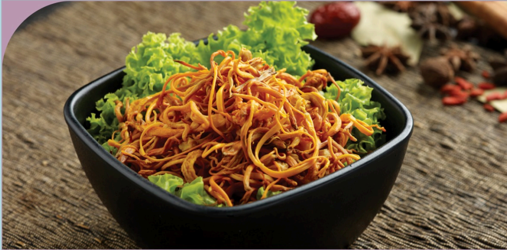
ĐÔNG TRÙNG HẠ THẢO Cordyceps Flower