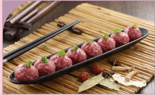
BÒ VIÊN Beef ball

79.000 VND Nửa phần - Half portion 149.000 VND Một phần - Per portion