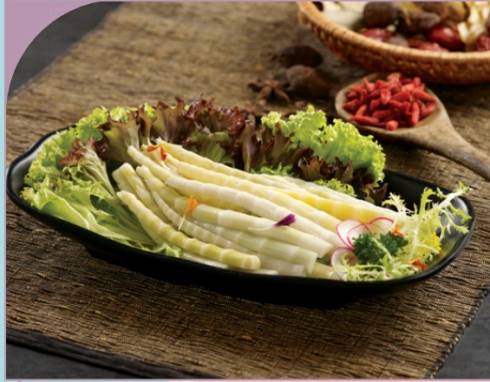
MĂNG NON Baby Bamboo Shoot