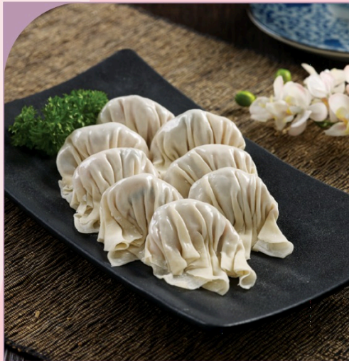
SÙI CẢO TÔM Prawn Dumpling

69.000 VND Nửa phần - Half portion 129.000 VND Một phần - Per portion