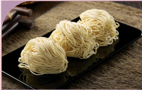
MÌ TRỨNG La Mian

39.000 VND Nửa phần - Half portion 69.000 VND Một phần - Per portion