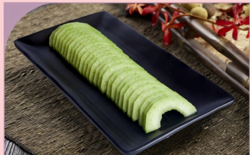
BÍ ĐÀO THÁI LÁT Sliced Winter Melon

29.000 VND Nửa phần - Half portion 49.000 VND Một phần - Per portion