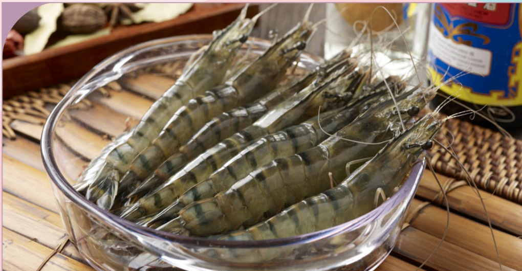
TÔM TƯƠI NGÂM RƯỢU Live Drunken Tiger Prawn