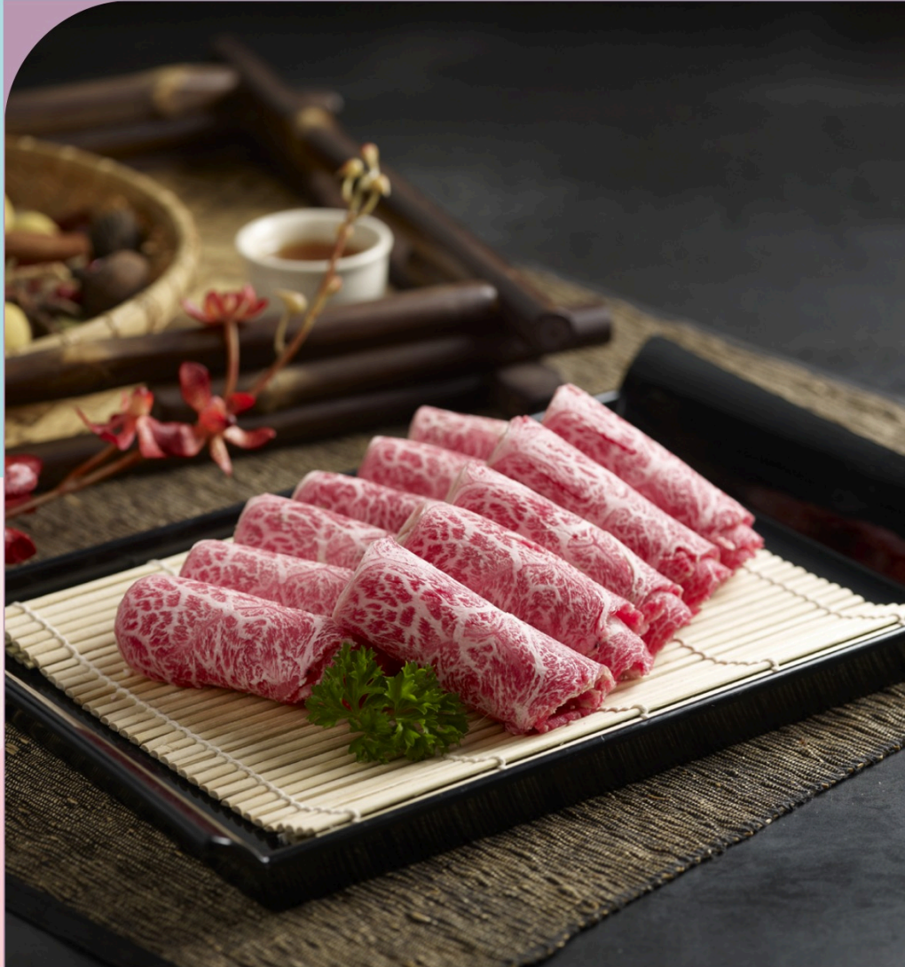
BÒ WAGYU MỸ US Wagyu Beef