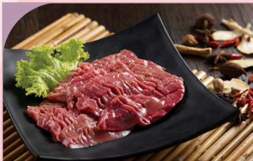
CẬT HEO Pig's Kidney

49.000 VND Nửa phần - Half portion 89.000 VND Một phần - Per portion