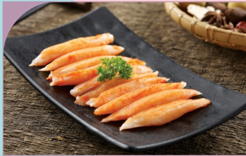
THANH CUA NHẬT BẢN Japanese Crab Stick

59.000 VND Nửa phần - Half portion 109.000 VND Một phần - Per portion