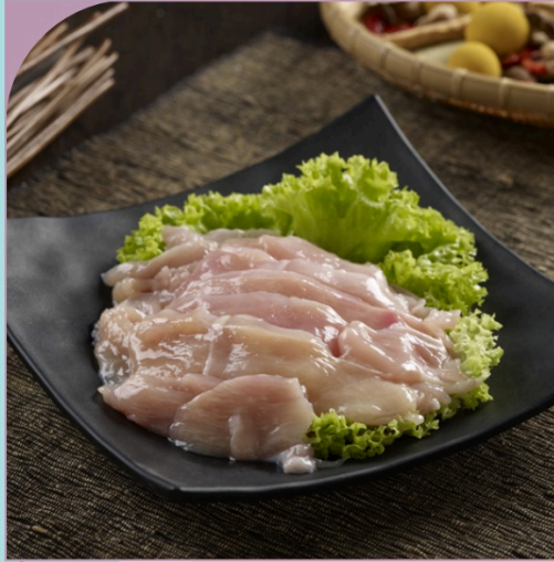
ỨNG GÀ THÁI LÁT Sliced Chicken Breast

59.000 VND Nửa phần - Half portion 109.000 VND Một phần - Per portion