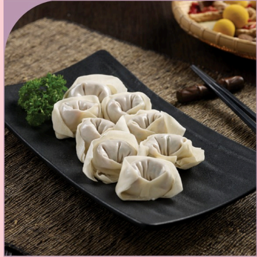
SÙI CẢO THỊT HEO & HÈ Pork and Chive Dumpling

89.000 VND Nửa phần - Half portion 169.000 VND Một phần - Per portion