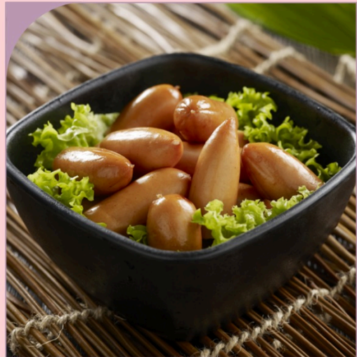
XÚC XÍCH GÀ GIÒN Crunchy Gourmet Chicken Sausage

59.000 VND Nửa phần - Half portion 109.000 VND Một phần - Per portion