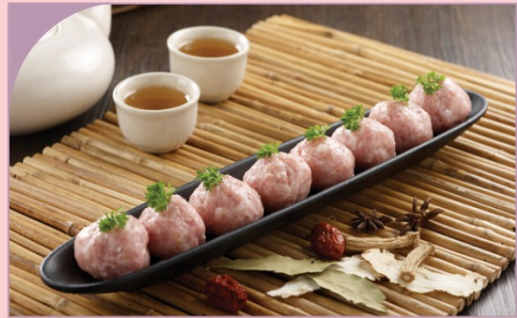
HEO VIÊN Pork Meat Ball

79.000 VND Nửa phần - Half portion 149.000 VND Một phần - Per portion