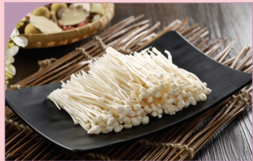
NẤM KIM CHÂM Enoki Mushroom