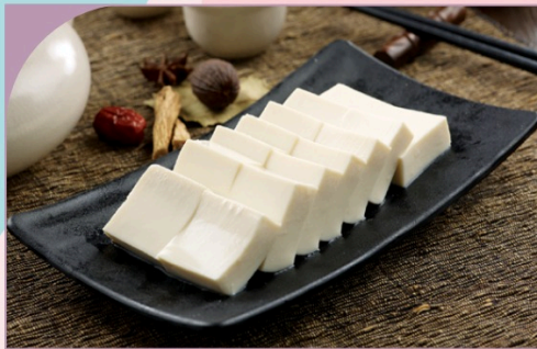
ĐẬU PHỤ NON Silken Tofu

39.000 VND Nửa phần - Half portion 69.000 VND Một phần - Per portion