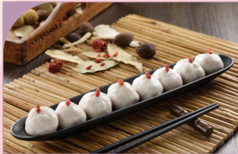
MỰC VIÊN Squid Ball

69.000 VND Nửa phần - Half portion 129.000 VND Một phần - Per portion