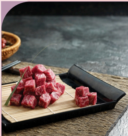
THĂN BÒ ỨC CẮT KHỐI AUS Marbled Beef Cube