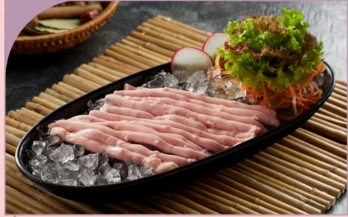
TỦY HEO Bone Marrow

109.000 VND Nửa phần - Half portion 209.000 VND Một phần - Per portion