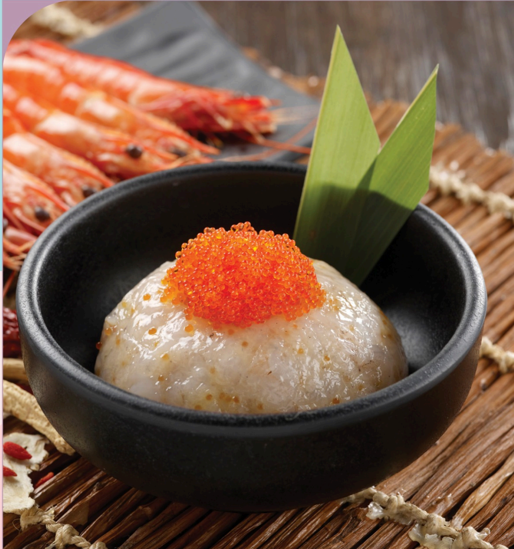
CHÀ TÔM BẮM CÙNG TRỨNG EBIKO Ebiko Prawn Paste