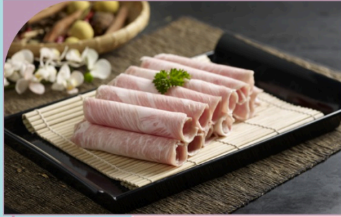
THỊT NỌNG HEO Pork Jowl

109.000 VND Nửa phần - Half portion 209.000 VND Một phần - Per portion