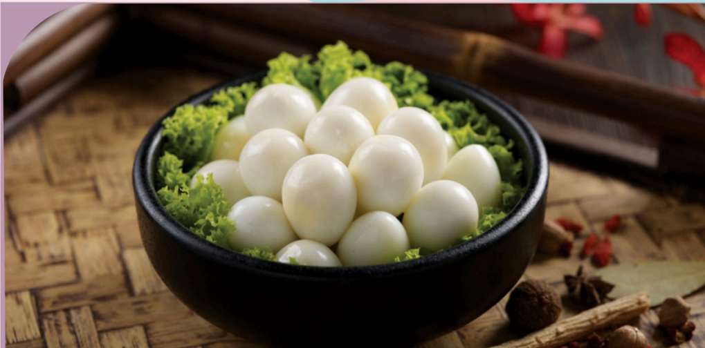
TRỨNG CÚT Quail's Egg