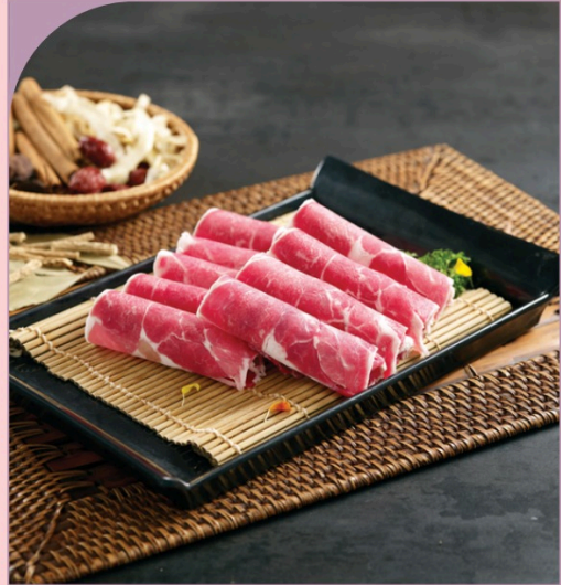
THỊT CỪU THÁI LÁT Sliced Lamb

99.000 VND Nửa phần - Half portion 189.000 VND Một phần - Per portion