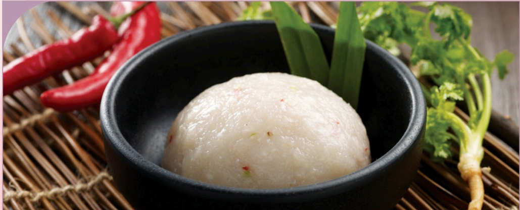
CHÀ CÁ Fish Paste