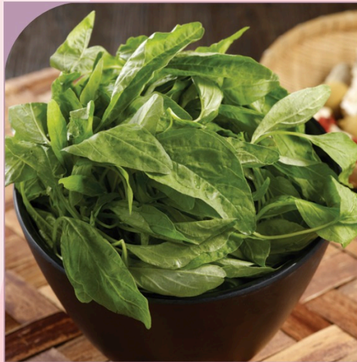
RAU MỒNG TÔI Malaba Spinach

39.000 VND Nửa phần - Half portion 69.000 VND Một phần - Per portion