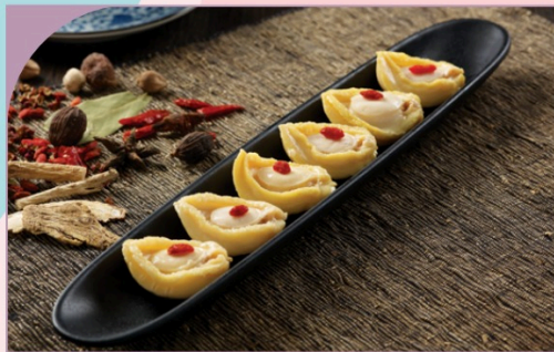
BÀO NGƯ 10-Head Abalone

59.000 VND Nửa phần - Half portion 109.000 VND Một phần - Per portion