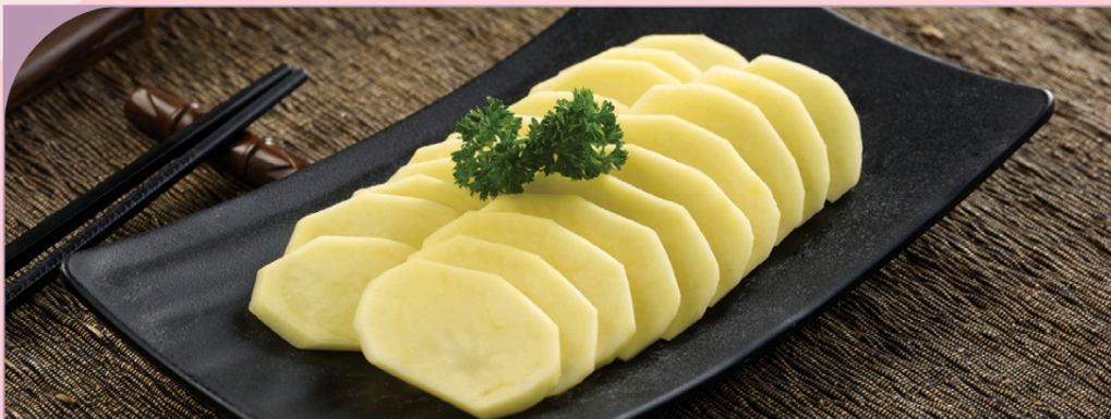
KHOAI TÂY THÁI LÁT Sliced Potato

30.000 VND Nửa phần - Half portion 60.000 VND Một phần - Per portion