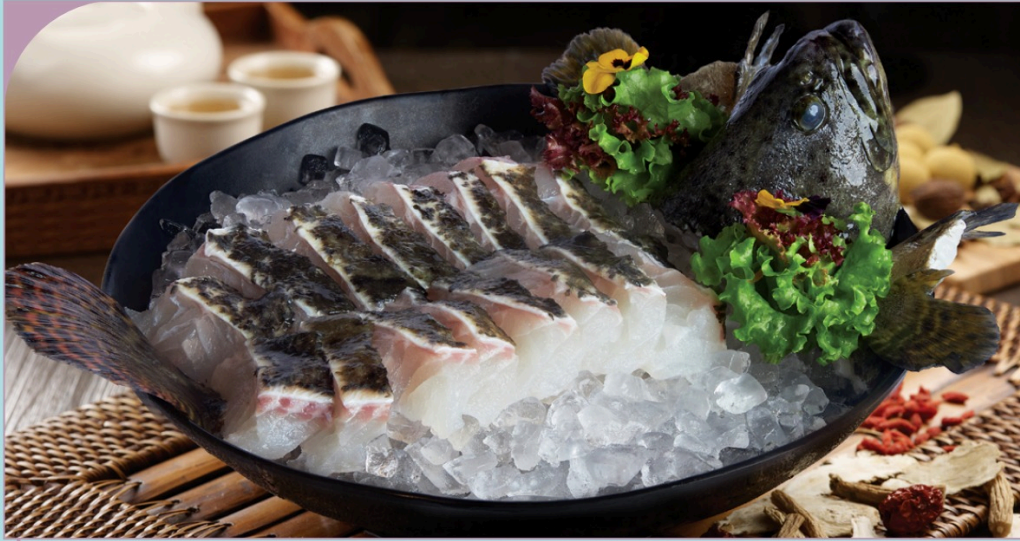
CÁ MÚ ĐEN Black Garoupa