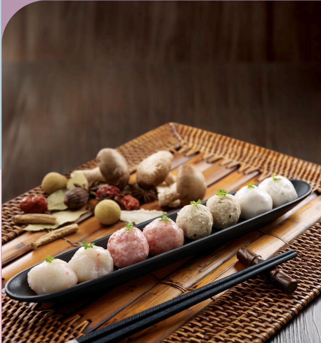
SET THỊT VIÊN THẬP CẨM Assorted Ball Platter