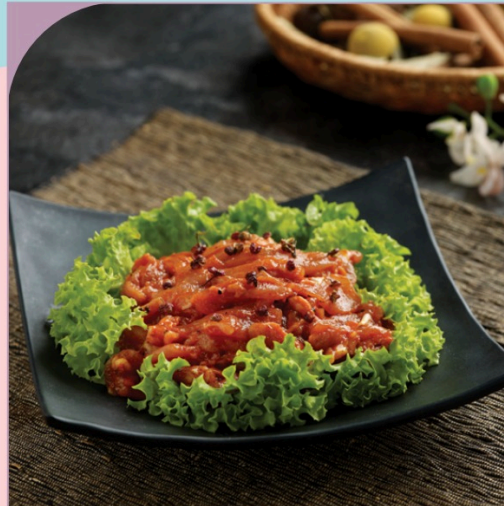
THỊT HEO CAY THÁI LÁT Spicy Sliced Pork

69.000 VND Nửa phần - Half portion 129.000 VND Một phần - Per portion