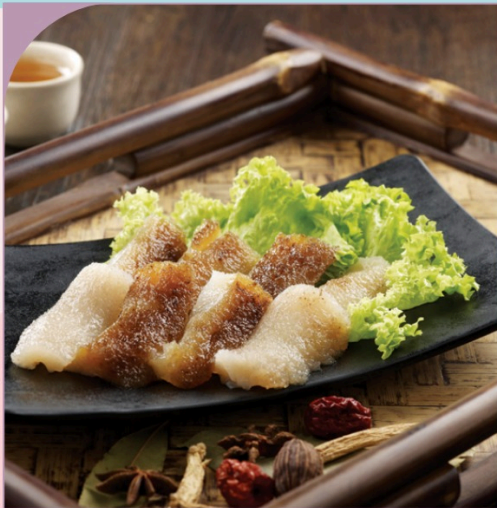
HẢI SÂM Sea Cucumber

219.000 VND Nửa phần - Half portion 429.000 VND Một phần - Per portion