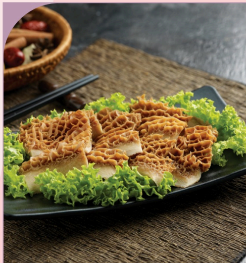
BAO TỬ BÒ Braised Cow's Stomach

129.000 VND Nửa phần - Half portion 249.000 VND Một phần - Per portion