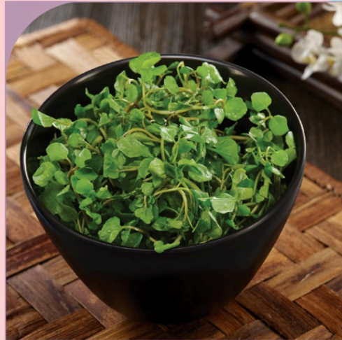
XÀ LÁCH XOONG Watercress