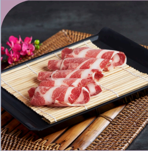
THỊT BA CHỈ HEO IBERICO Iberico Pork Belly

179.000 VND Nửa phần - Half portion 349.000 VND Một phần - Per portion