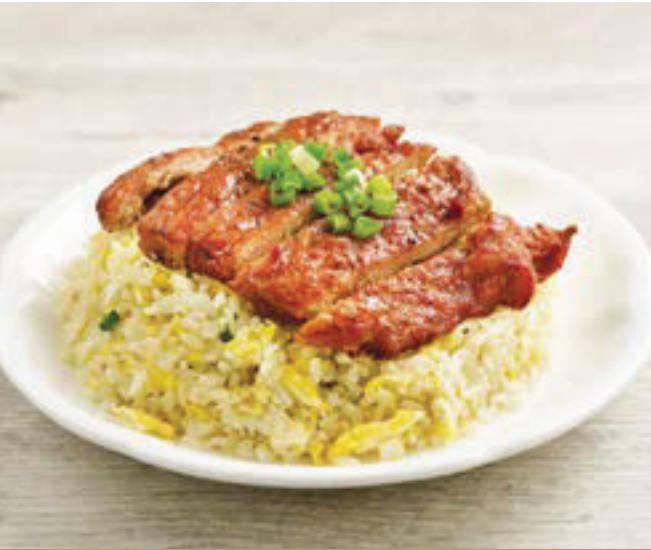
G8 បាយតាជាមួយសាច់ជ្រូកស្រួយ 香酥猪扒炒饭 Fried Rice with Crispy Pork Chop $12.80 / 例