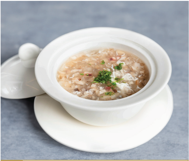
CS20 ស៊ុបគ្រឿងសមុទ្រ 竹笙海鲜羹 Seafood Thick Soup 🍴🔥 $5.80 / 例