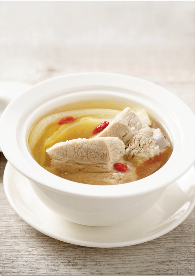
C3 ស៊ុបឆ្អឹងជំនីត្រួកជាមួយស្ពៃចិន 清炖菜胆排骨汤 Double-boiled Pork Rib with Cabbage Soup $9.80 / 位