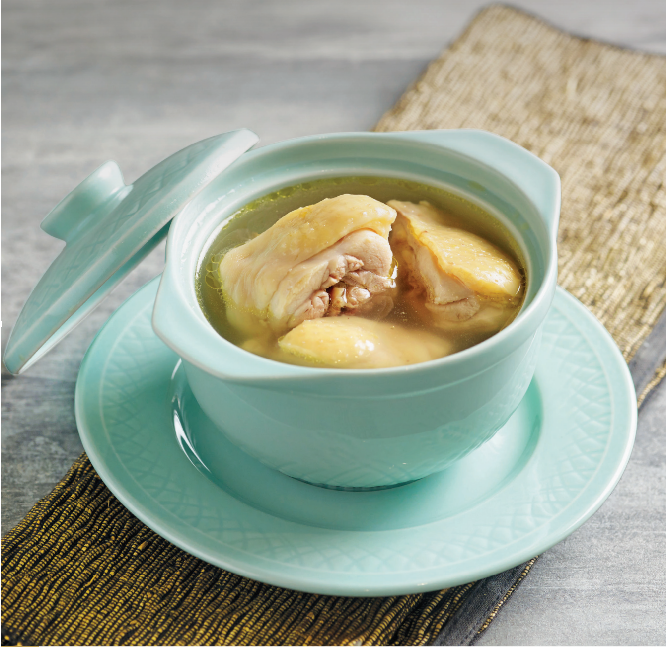
C1 ស៊ុបមាន់ពិសេស 清炖鸡汤 Double-boiled Chicken Soup $8.80 / 位