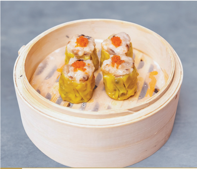
CS2 ស៊ីវ៉ៃម៉ៃ 干蒸烧卖 Prawn & Pork Siew Mai $4.80 / 例