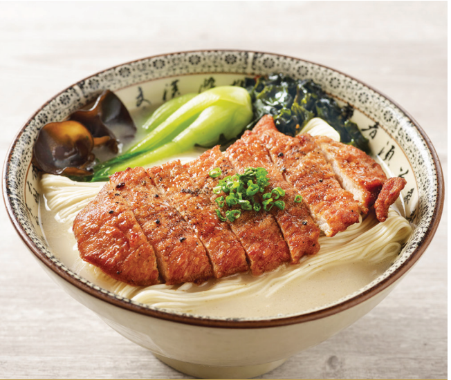
H2 ស៊ីបមីឡាម៉េនជាមួយសាច់ជ្រូកស្រួយ 香酥猪扒猪骨汤拉面 La Mian with Crispy Pork Chop in Signature Pork Bone Soup $10.80 / 例