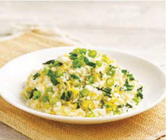
G9 បាយតាបន្លែ 鲜蔬炒饭 Fried Rice with Assorted Vegetable $6.80 / 例