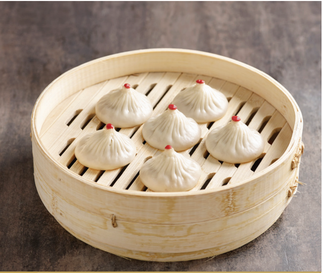
B2 ស៊ាវឡុងប៉ាវសជាតិសាច់មាន់ចិត្រ្តាំ 鸡肉小笼包 Minced Chicken Xiao Long Bao $7.80 6 pc / 粒 $12.80 10 pc / 粒