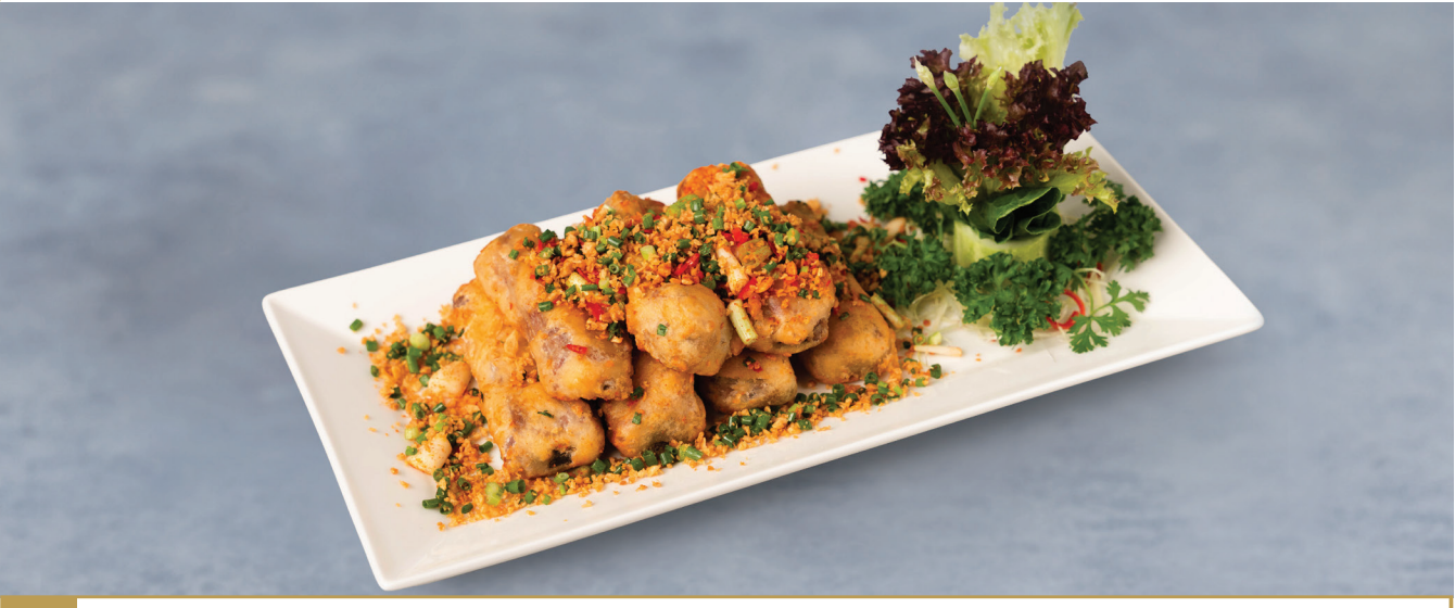
CS16 ឆ្អឹងជំនីជ្រូកបំពងជាមួយខ្ទឹមស 蒜香排骨 Crispy Pork Spare Rib with Spicy Salt and Garlic 🍴🔥 $16.80 / 例