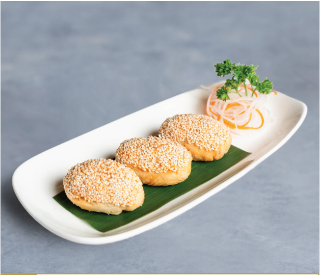
CS11 នំស្រួយសៀងហៃ 上海叉燒酥 Shanghai BBQ Pork Pastry 🍴 $4.80 / 例