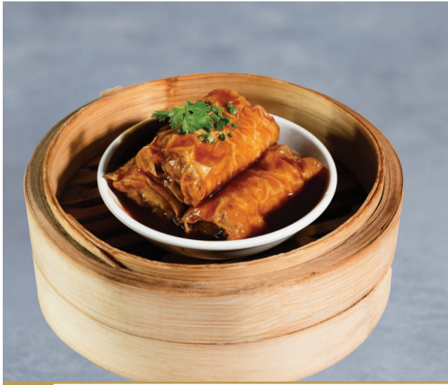
CS8 ពពុះសណ្តែករុំគ្រឿងសមុទ្រជាមួយប្រេងខ្យង 蚝皇鲜竹卷 Seafood Beancurd Roll in Oyster Sauce $4.80 / 例