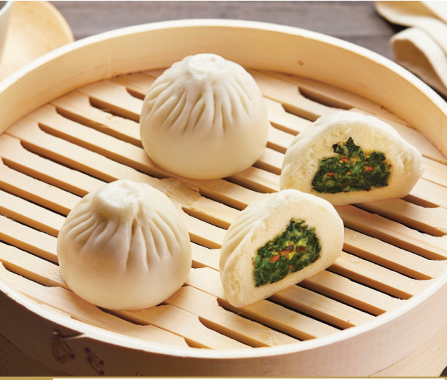
B4 នំប៉ាវបន្លែចំហុយ 家乡蔬菜包 Steamed Vegetable Bun $4.80 3 pc / 粒