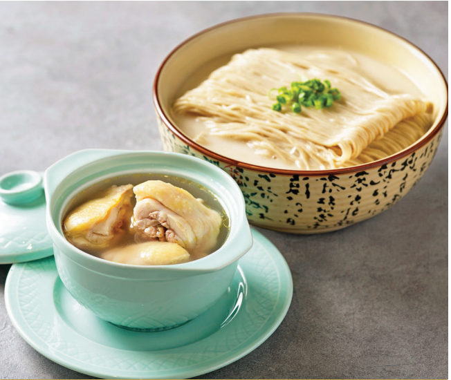
H6 មីឡាម៉េនជាមួយស៊ីបមាន់ពិសេស 清炖鸡汤拉面 La Mian served with Double-boiled Chicken Soup $10.80 / 例