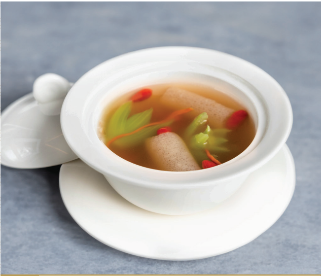
CS19 ស៊ុបបន្លែ 五宝蔬菜汤 Vegetable Clear soup 🍴 $4.80 / 例