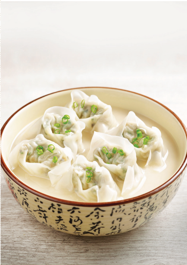
C4 ស៊ុបគាវបន្លែសាច់ត្រួក 菜肉云吞猪骨汤 Vegetable and Pork Wonton in Signature Pork Bone Soup $7.80 6 pc / 粒