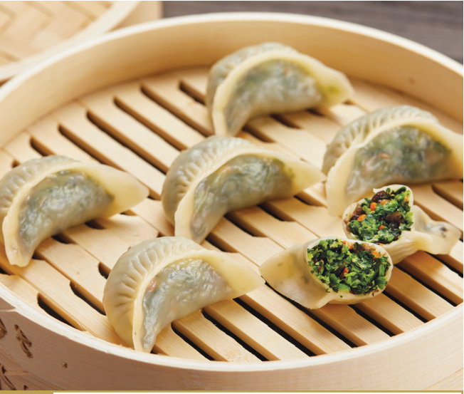
B5 តាវបន្លែចំហុយ 花蔬蒸饺 Steamed Vegetable Dumpling $6.80 6 pc / 粒