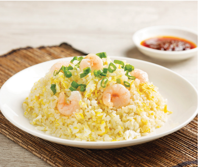
G5 បាយតាបង្កា 雪菜虾仁炒饭 Fried Rice with Shrimp and Preserved Vegetable $8.80 / 例