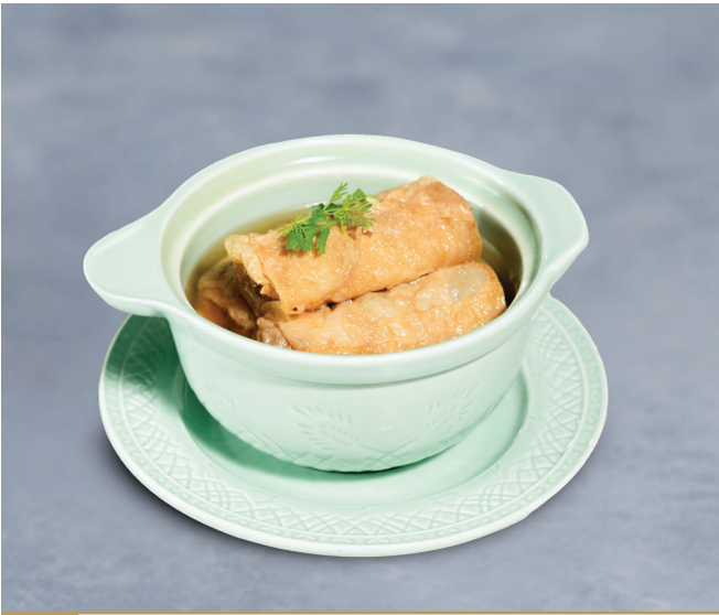
CS6 ស៊ីបពពុះសណ្តែករុំគ្រឿងសមុទ្រ 上汤腐竹卷 Seafood Beancurd Roll in Broth Soup $4.80 / 例