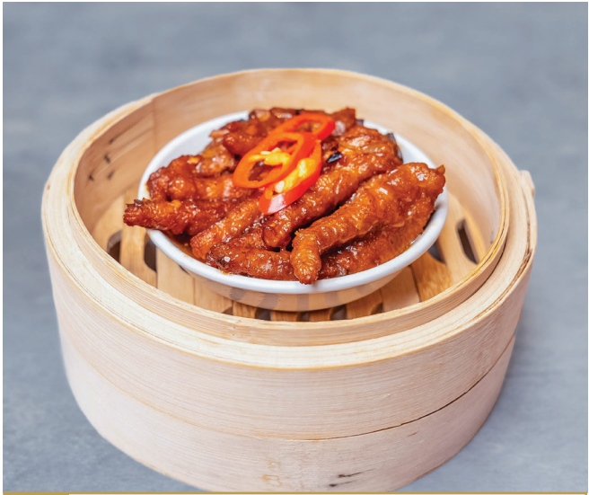
CS3 ជើងមាន់ចំហុយសៀងខ្មៅ 豉汁蒸凤爪 Chicken Feet with Black Bean Sauce $3.80 / 例