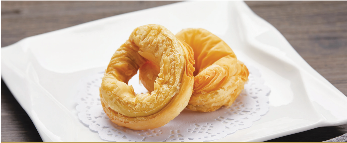
B8 នំស្លឹកខ្ចីមបំពង់ស្រួយ 闻香葱油饼 Scallion Pastry $4.80 2 pc / 粒