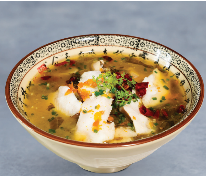
CS24 ស៊ីបជូរហិរត្រីបន្ទះស្ពៃជូរ 皇朝酸菜鱼 Specialty Fish in Pickled Vegetable Broth $20.80 / 例