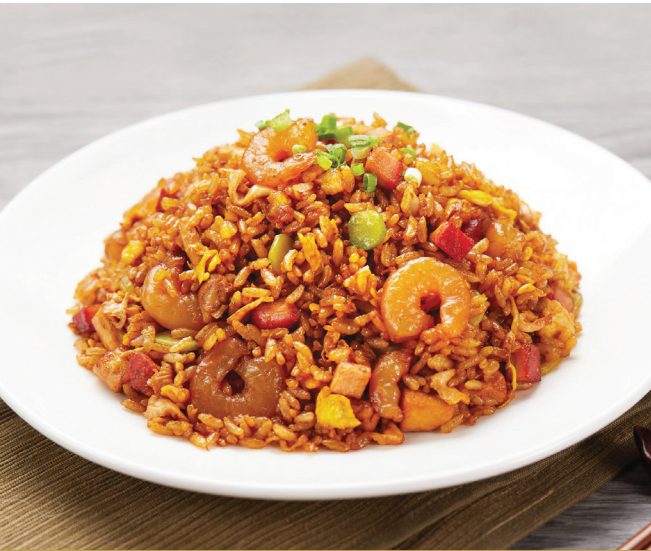
G6 បាយតាសៀងហៃ 上海炒饭 Fried Rice in Shanghai Style $8.80 / 例