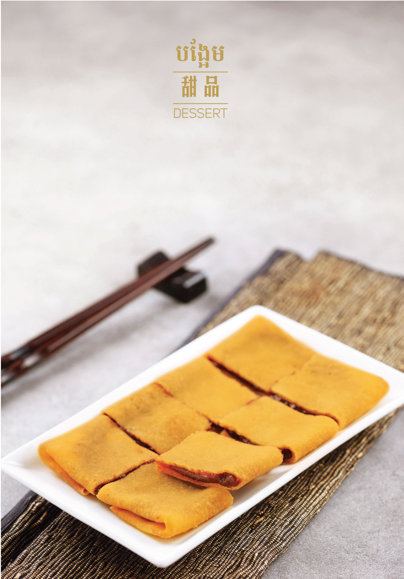
J1 នំភេនខេកស្លូសណែកក្រហម 香煎豆沙锅饼 Pan-fried Pancake with Red Bean Paste $4.80 / 例