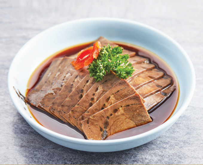
D13 ជាក់ឡូវកំភួនជើងគោពិសេស 陈皮五香牛肉 Spiced Beef Shank $7.80 / 例