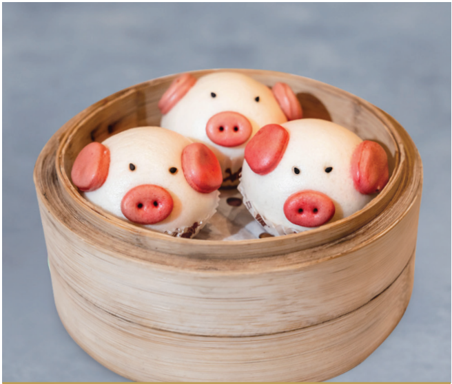
CS5 នំប៉ាវស្លូលពោត 奶油玉米猪仔包 Piggy Bun with Creamy Corn $5.80 / 例