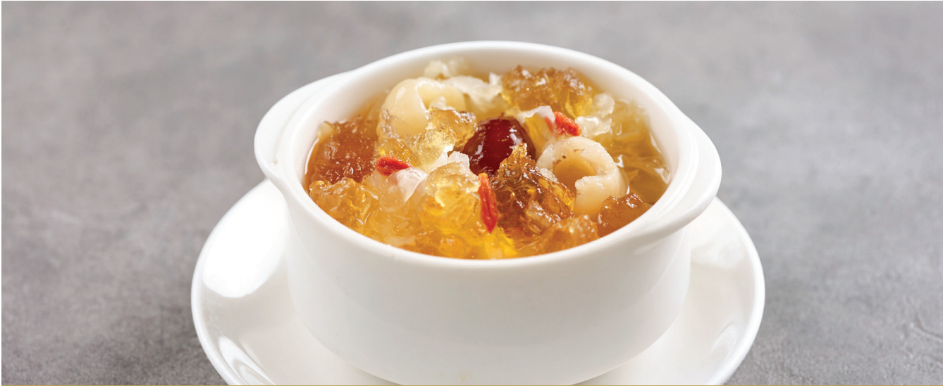
J9 បង្ហែមព្រិលត្រជាក់ផ្លែប៉េស 贵妃银耳桃胶 Chilled Snow Fungus with Peach Resin $4.80 / 位