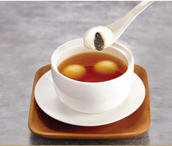
J4 បង្ហែមនំអ៊ីស្លូលលូខ្មៅ 姜茶黑芝麻汤圆 Black Sesame Glutinous Rice Ball served in Ginger Soup $3.80 3 pc / 粒