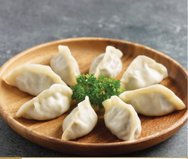
B7 តាវស្រុះស្កលសាច់ជ្រូក 三鲜鲜肉水饺 Poached Vegetable and Pork Dumpling $6.80 8 pc / 粒