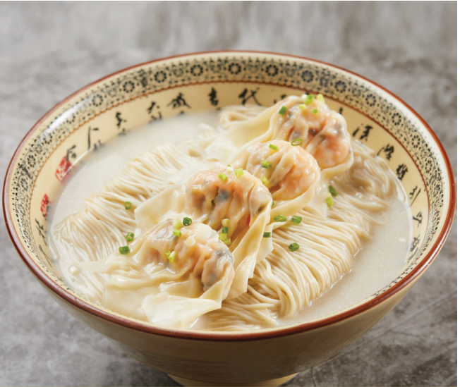
H4 ស៊ីបមីឡាម៉េនជាមួយតាវស្វ្វលបង្កាសាច់ជ្រូក 鲜虾猪肉云吞猪骨汤拉面 La Mian with Prawn and Pork Wonton in Signature Pork Bone Soup $10.80 / 例