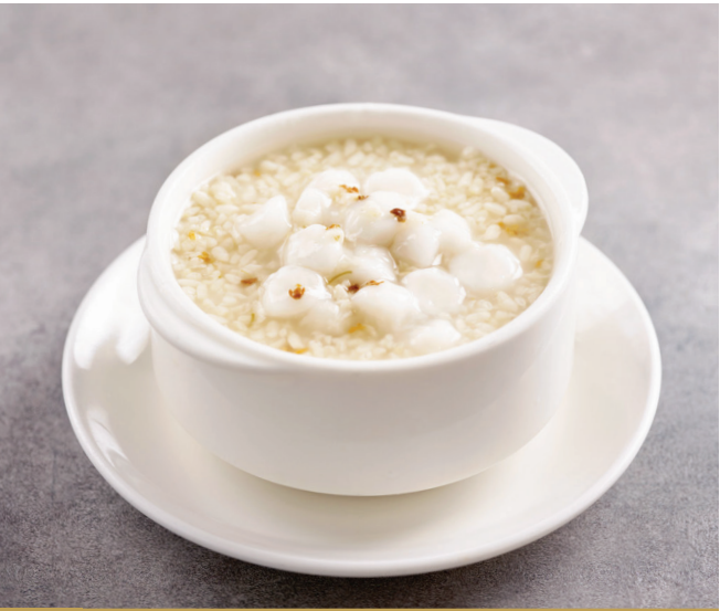
J5 បង្ហែមនំអ៊ីអប់ស្រាអង្ករ 桂花酒酿丸子 Glutinous Rice Ball in Fermented Rice Wine $3.80 / 位