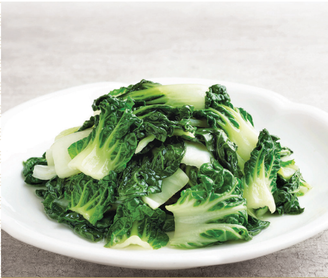
E16 តាកូនស្ពៃចិន 清炒白菜苗 Stir-fried Baby Cabbage $6.80 / 例