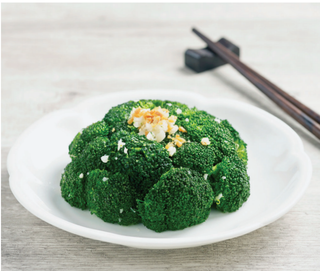
E13 តាខាត់ណាបៃតង 蒜蓉西兰花 Stir-fried Broccoli with Minced Garlic $6.80 / 例