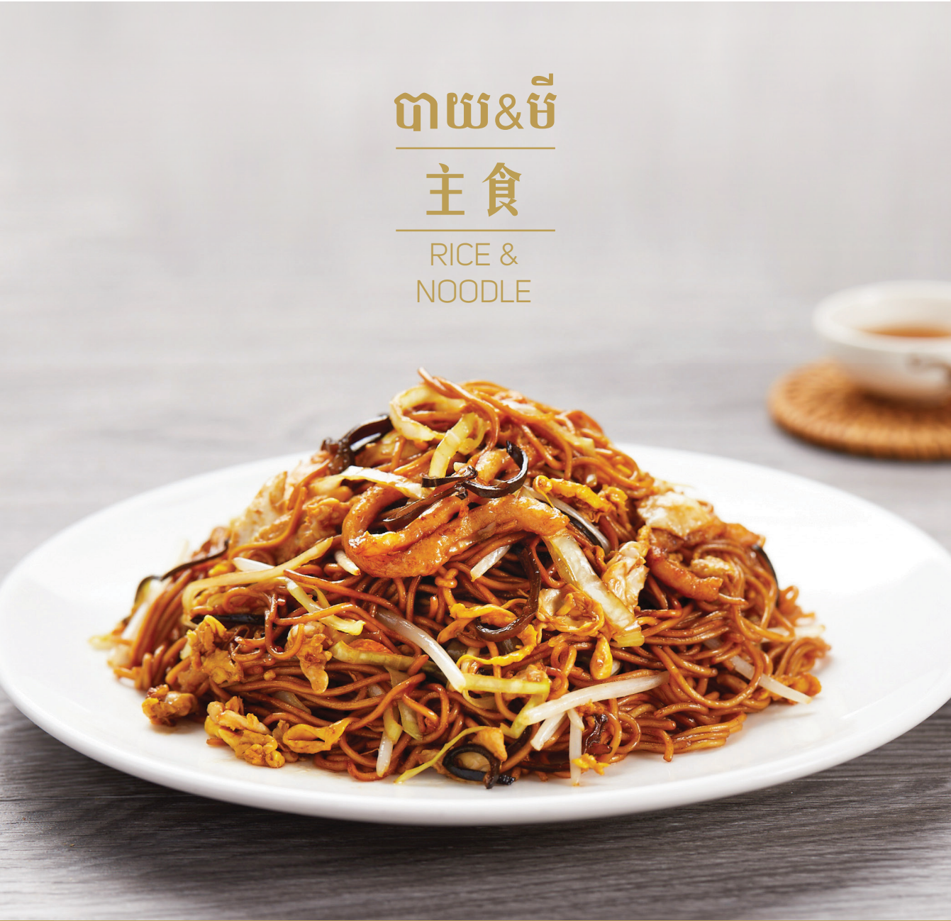
G1 មីតាសៀងហៃ 木樨肉炒面 Stir-fried Noodle with Shredded Pork and Black Fungus $8.80 / 例