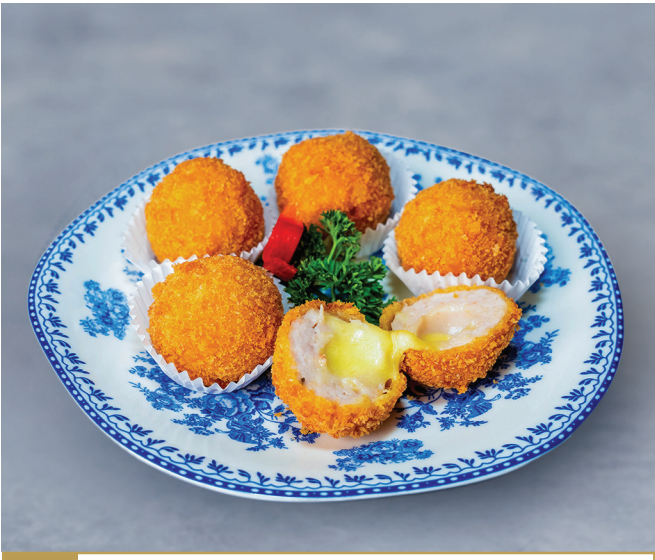
CS14 ប្រហិតបង្ហាបំពងជាមួយឈើស 芝士虾肉球 Crispy Prawn Meat Balls Stuffed with Cheese 🍴🔥 $5.80 / 例