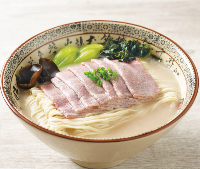
H1 ស៊ីបមីឡាម៉េនជាមួយសាច់ជ្រូកគួរ្យូតា 美国黑猪肉卷猪骨汤拉面 La Mian with Sliced Kurobuta Pork in Signature Pork Bone Soup $12.80 / 例