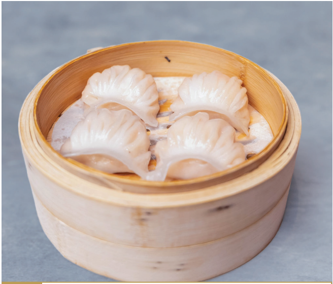
CS1 ហាកាវ 水晶虾饺 Steamed Prawn Dumpling $4.80 / 例