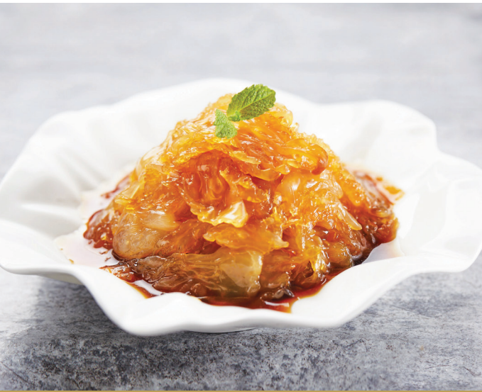
D11 ត្រីពេលីជាមួយទឹកស៊ីអ៊ីវធូរពិសេស 醋酱海蜇头 Jellyfish in Soy Sauce Vinaigrette $8.80 / 例