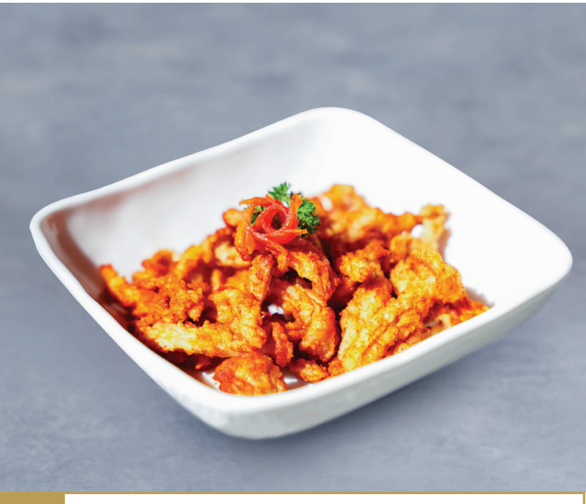
CS17 ផ្សិតស៊ីមីជីបំពងស្រួយ 脆皮姬菇配辣盐 Crispy Shimeji Mushroom with Spicy Salt 🍴🔥 $4.80 / 例