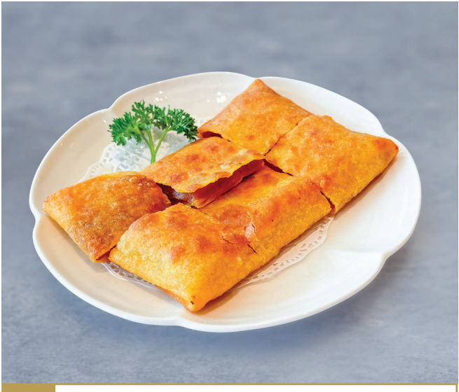
CS18 នំភេនខេកស្ងួលពុទ្រា 枣泥锅饼 Pan-fried Pancake with Red Dates Paste 🍴 $4.80 / 例