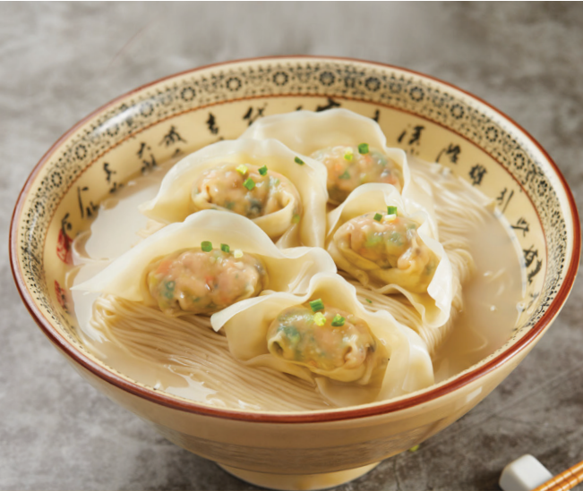
H3 ស៊ីបមីឡាម៉េនជាមួយតាវស្វ្វលសាច់ជ្រូក 菜肉云吞猪骨汤拉面 La Mian with Vegetable Pork Wonton in Signature Pork Bone Soup $9.80 / 例