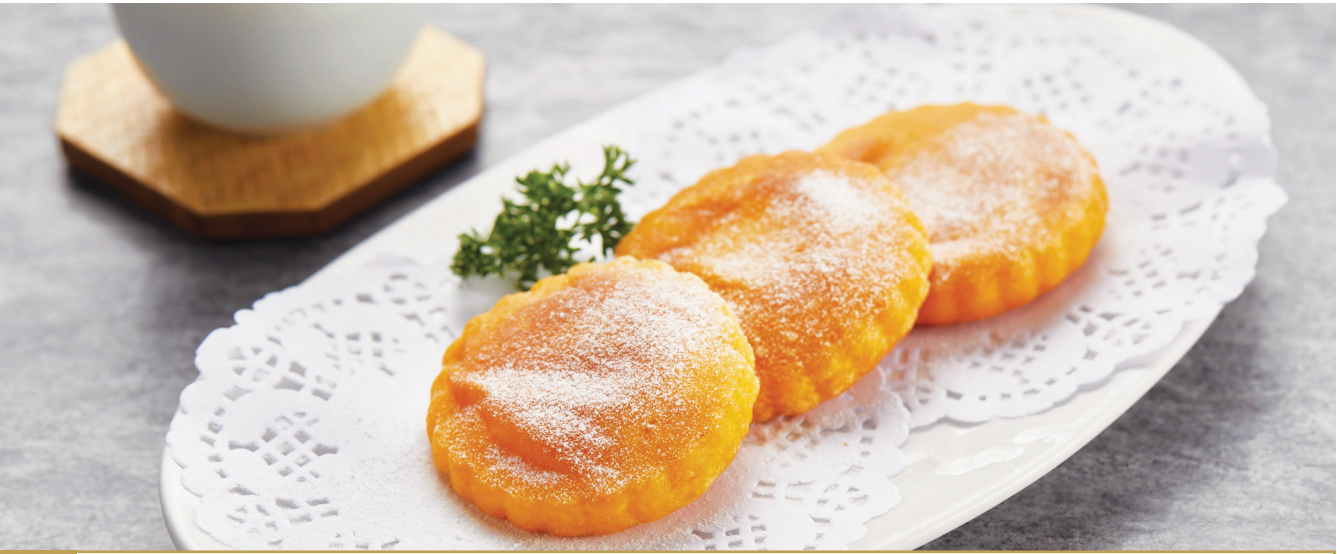
J3 នំល្ហៅចៀន 香煎南瓜饼 Pan-fried Pumpkin Pastry $3.80 3 pc / 片