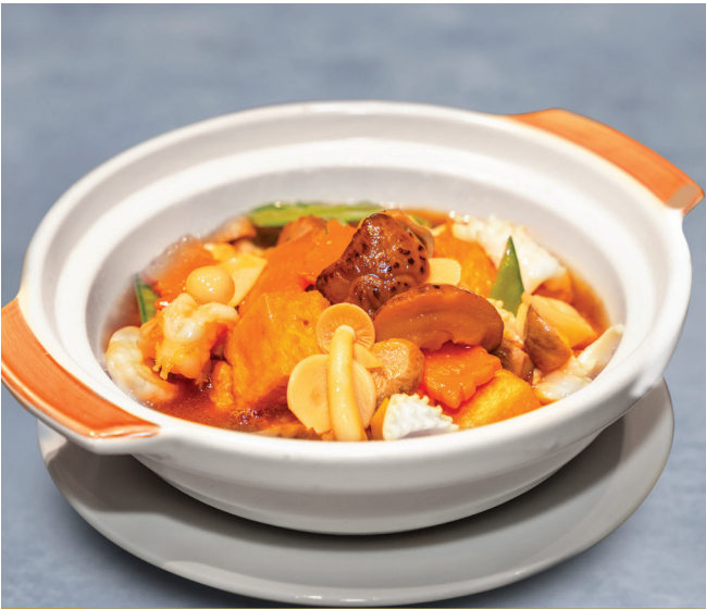
CS23 តៅហ៊ុំអប់គ្រឿងសមុទ្រឆ្នាំងដី 自制海鲜豆腐 Homemade Tofu with Seafood $12.80 / 例