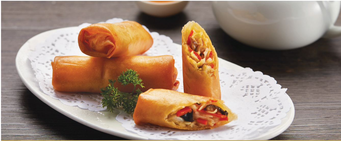
B9 នៃយីបំពង់ស្កុលបន្លែ 淮扬三丝春卷 Crispy Vegetable Spring Roll $5.80 3 pc / 粒