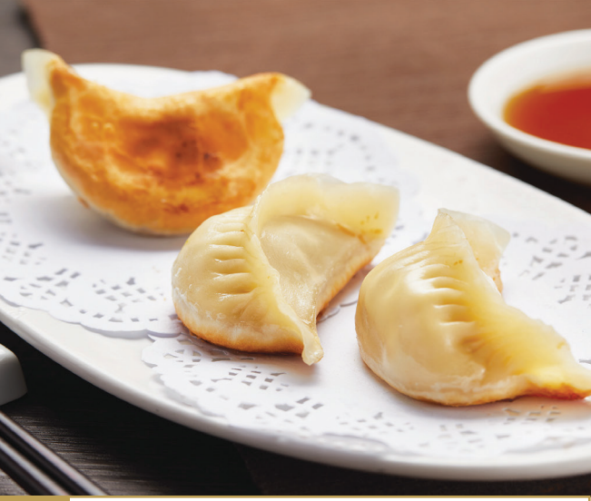
B6 តាវចៀនស្កលសាច់ជ្រូក 无锡鲜肉锅贴 Pan-fried Pork Dumpling $4.80 3 pc / 粒