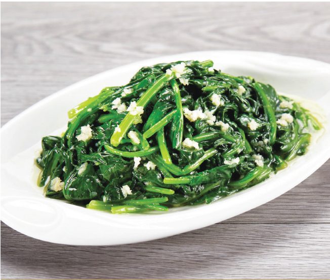
E17 តាដើមថ្កូវចិនជាមួយខ្លីមស 蒜茸炒菠菜 Stir-fried Spinach with Minced Garlic $6.80 / 例