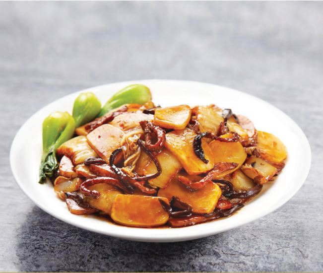
G3 តានំម្សៅអង្ករបែបសៀងហៃ 上海炒年糕 Wok-fried Rice Cake with Pork and Vegetable in Shanghai Style $8.80 / 例