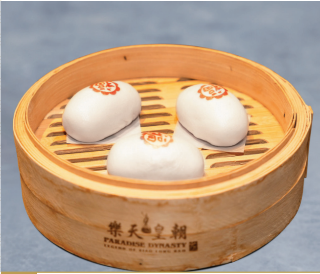
CS7 នំប៉ាវស្លូលពុទ្រាត្រហមចិន 枣泥包 Red Dates Paste Bun $4.80 / 例