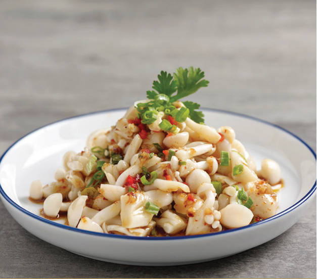
D14 ផ្សិតត្រជាក់ស៊ីមុជី 凉拌香辣白玉菇 Chilled White Shimeji Mushroom in Peppercorn Vinaigrette $4.80 / 例