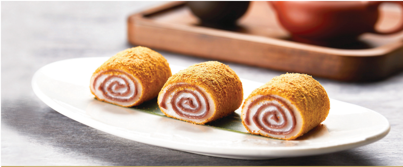
J6 នំម្សៅដំណើបស្លូសសណ្តែកក្រហម 宫廷驴打滚 Red Bean Glutinous Rice Roll topped with Soy Bean Powder $4.80 3 pc / 粒