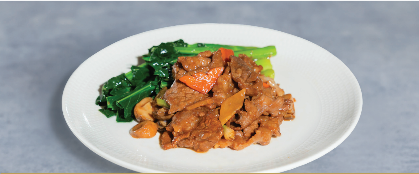
CS21 ឆាសាច់គោជាមួយខាត់ណាហុងកុង 蚝皇炒芥兰牛肉 Stir-Fried Beef with Hong Kong Kai Lan $18.80 / 例