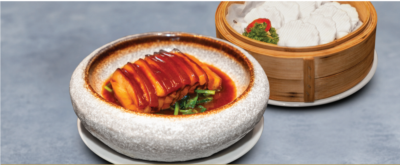
CS22 ហុងសាច់បីជាន់ 东坡肉（配包子） Braised Pork Belly with Steamed Bun $18.00 / 例