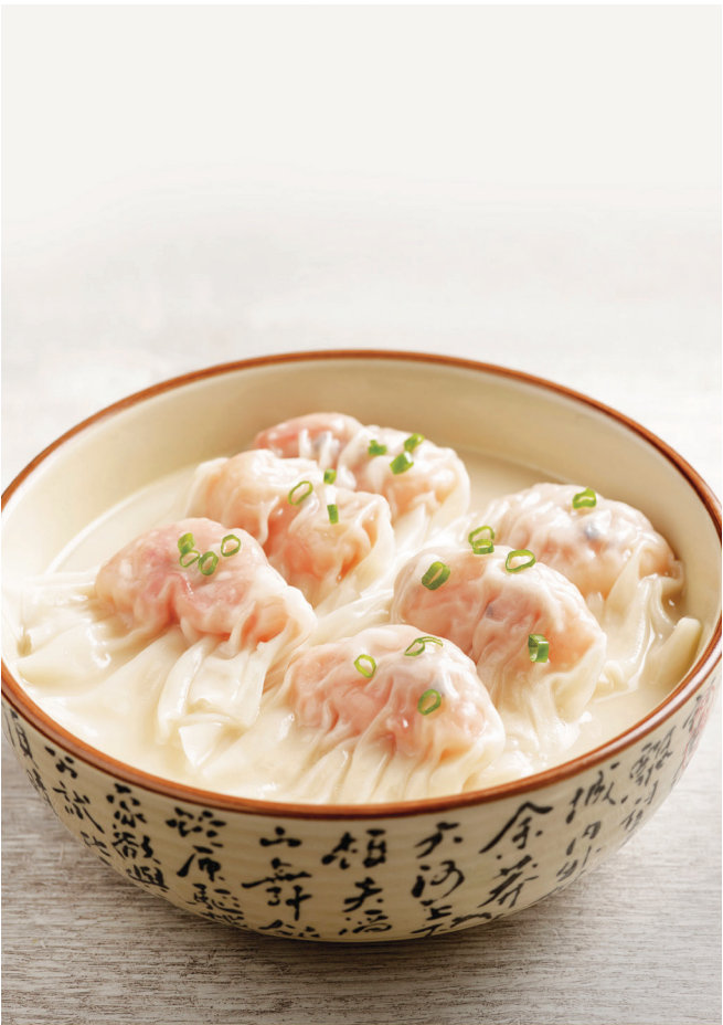
C5 ស៊ុបគាវបង្កានិងសាច់ត្រួក 鲜虾猪肉云吞猪骨汤 Prawn and Pork Wonton in Signature Pork Bone Soup $9.80 6 pc/粒