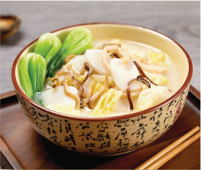
G2 ស៊ីបសាច់ជ្រូកពិសេសជាមួយនំម្សៅអង្ករ 肉丝年糕猪骨汤 Rice Cake with Shredded Pork in Signature Pork Bone Soup $8.80 / 例