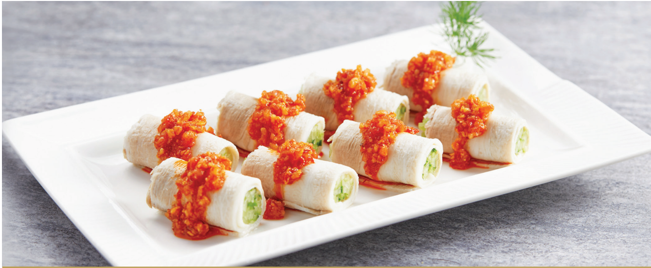
D7 សាច់ជ្រូកបន្លះជាមួយទឹកជ្រលក់ខ្លឹម 香辣蒜泥白肉 Poached Pork with Spicy Garlic Sauce $6.80 / 例