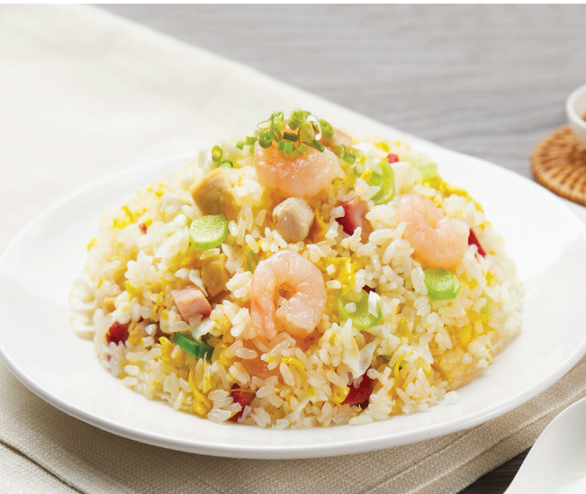
G4 បាយតាយ៉ុងចូវ 扬州炒饭 Fried Rice in Yang Zhou Style $8.80 / 例