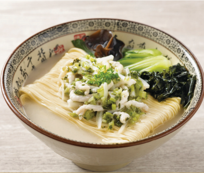
H5 ស៊ីបមីឡាម៉េនសាច់ជ្រូកសសៃនិងស្ពៃសៀងហៃ 雪菜肉丝猪骨汤拉面 La Mian with Shredded Pork and Preserved Vegetable in Signature Pork Bone Soup $10.80 / 例