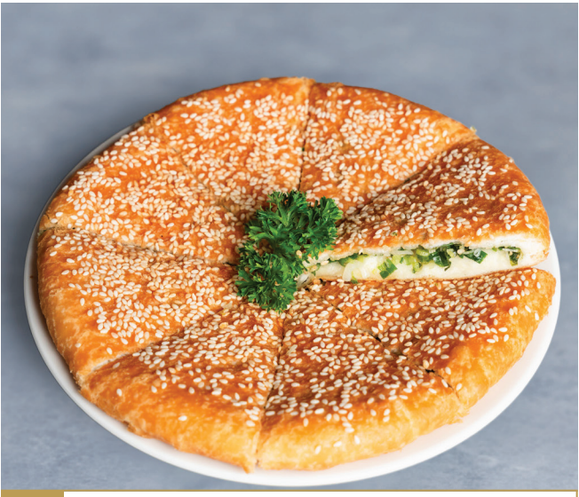
CS13 នំភេនខេកស្ងួលស្លឹកខ្ទឹម 葱油大饼 Chinese Pancake with Spring Onion 🍴 $4.80 / 例