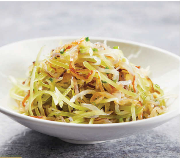
D12 ត្រីពេលីជាមួយទំពាំងបាវាំង 葱油莴笋拌海蜇丝 Jellyfish with Asparagus Lettuce in Scallion Oil $7.80 / 例