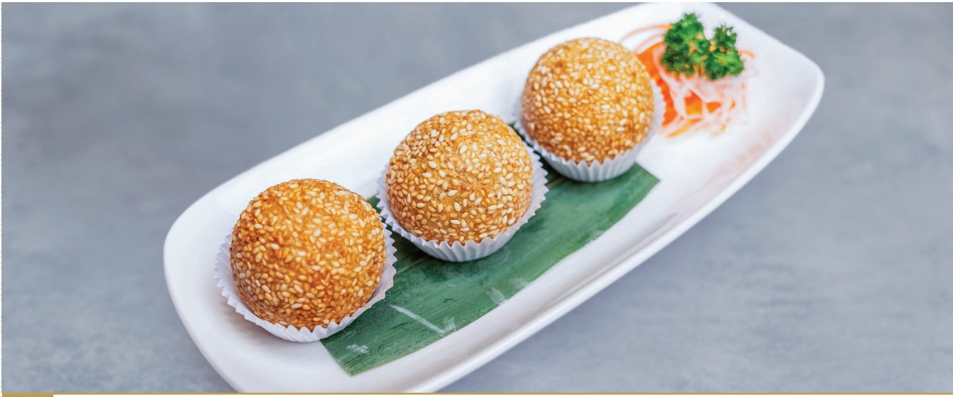
CS10 នំលូបំពងស្លូលសណ្តែកត្រហម 炸芝麻球 Glutinous Ball with Red Bean Paste $3.80 / 例