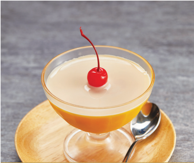
J7 ផុតឌីងរស់ជាតិស្វាយ 香芒布丁 Chilled Mango Pudding $3.80 / 位