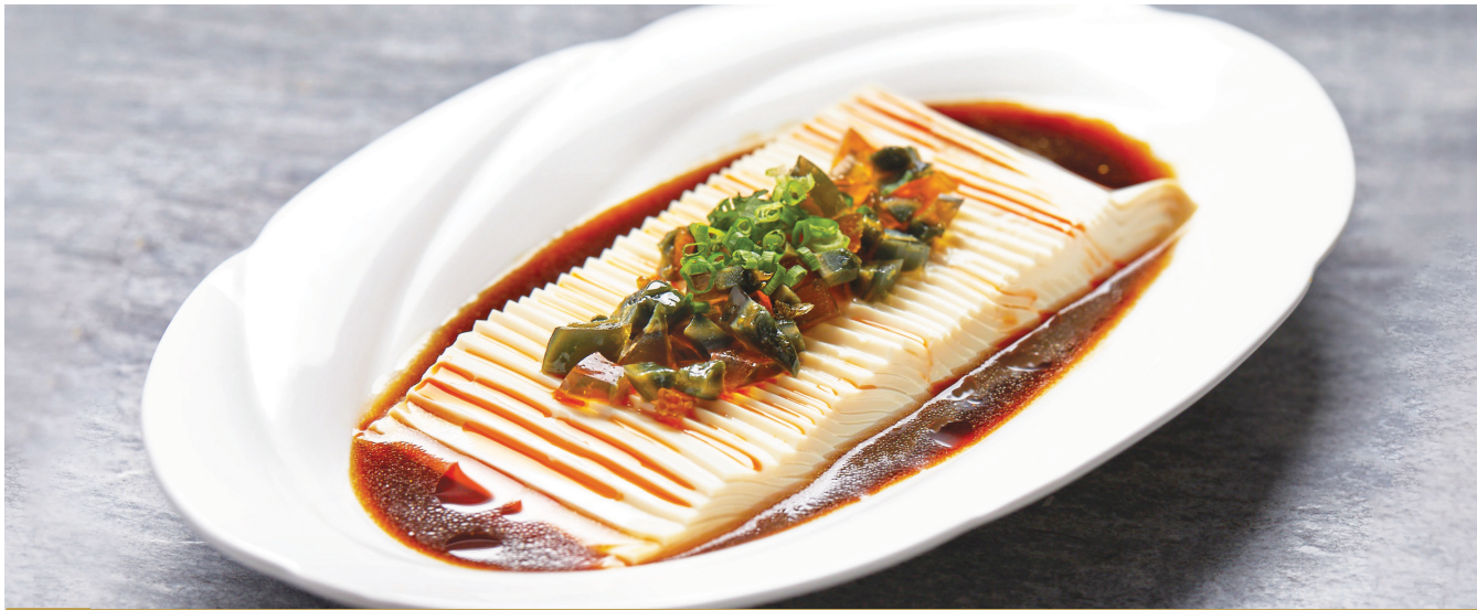
D8 តៅហ៊ីត្រជាក់ជាមួយស៊ុតខ្មៅ 松花皮蛋豆腐 Chilled Tofu with Century Egg $5.80 / 例