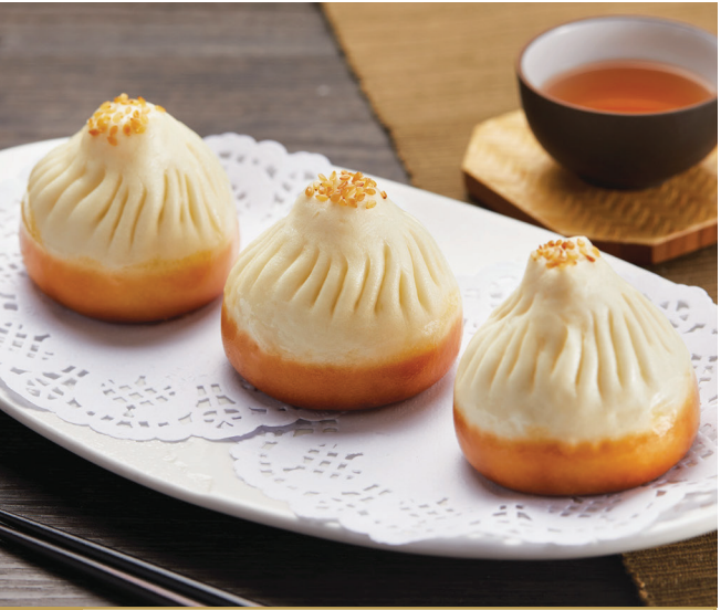
B3 នំប៉ាវចៀនបែបសៀងហៃ 上海生煎包 Pan-fried Shanghai Pork Bun $5.80 3 pc / 粒