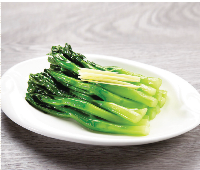
E14 តាកូនខាត់ណាហុងកុង 姜汁炒芥兰 Stir-fried Kai Lan withGinger Sauce $6.80 / 例