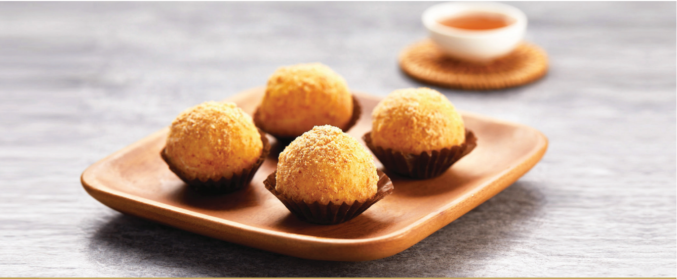
J2 នំលូខ្មៅ 播沙汤丸 Black Sesame Glutinous Rice Ball topped with Peanut Powder $3.80 4 pc / 粒