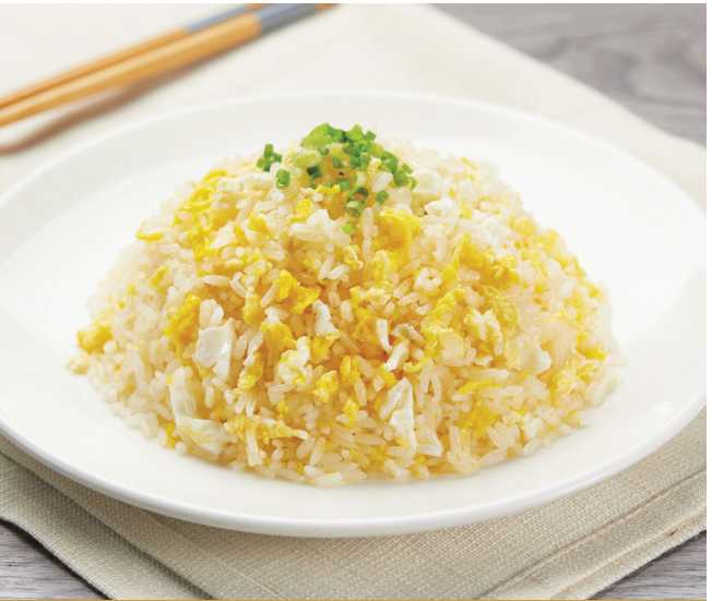
G7 បាយតាជាមួយស៊ុតមាន់ 蛋炒饭 Egg Fried Rice $6.80 / 例