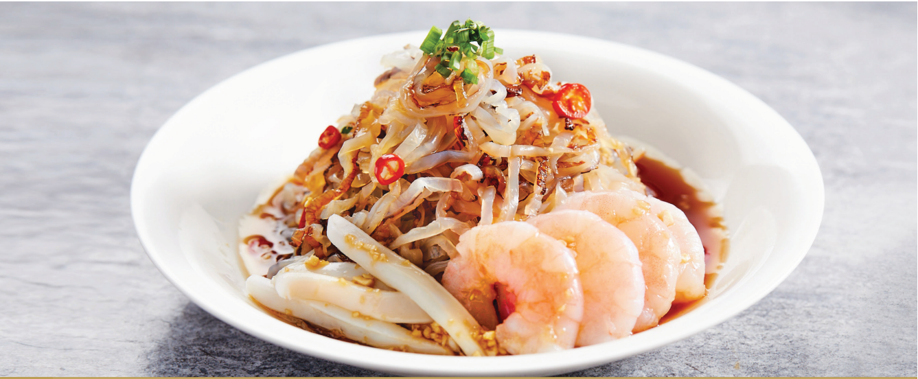
D10 ត្រីពេលីនិងគ្រឿងសមុទ្រជាមួយទឹកជ្រលក់ហុងកុង 捞拌海中宝 Jellyfish and Seafood in Vinaigrette $10.80 / 例