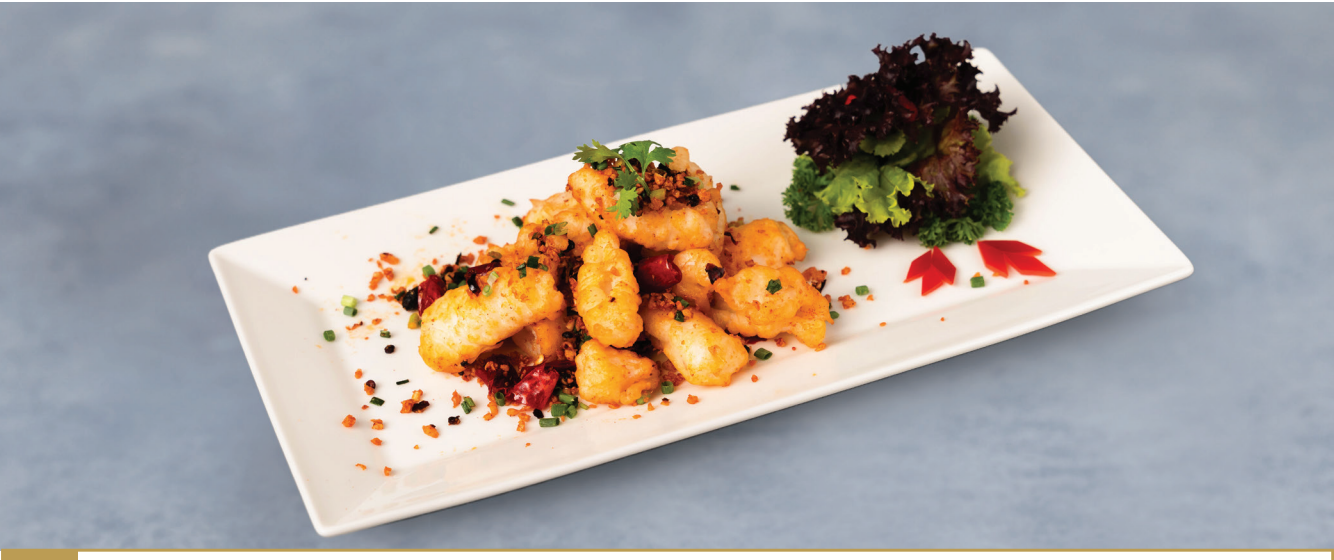
CS15 មីកបំពងស្រួយ 酥炸椒盐鲜鱿 Crispy Squid with Spicy Salt and Dried Chilli 🍴🔥 $13.80 / 例