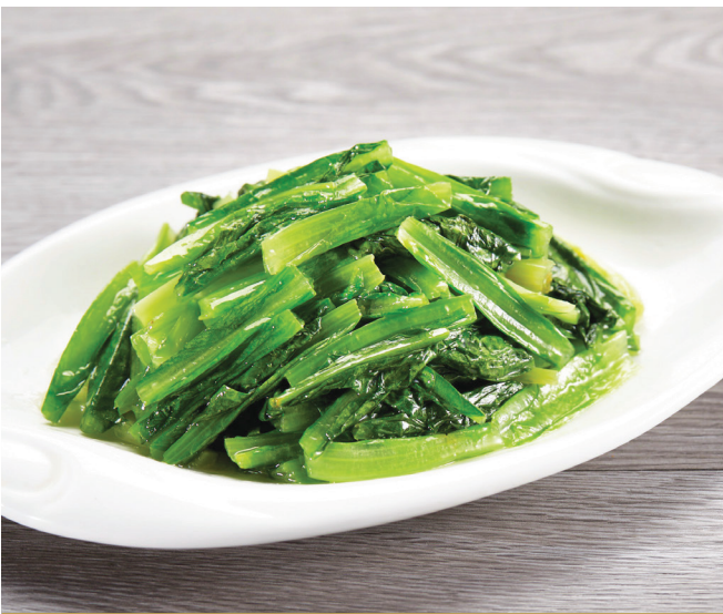
E15 តាសាលាដអូស្ត្រាលី 生炒油麦菜 Stir-fried Australian Lettuce $6.80 / 例