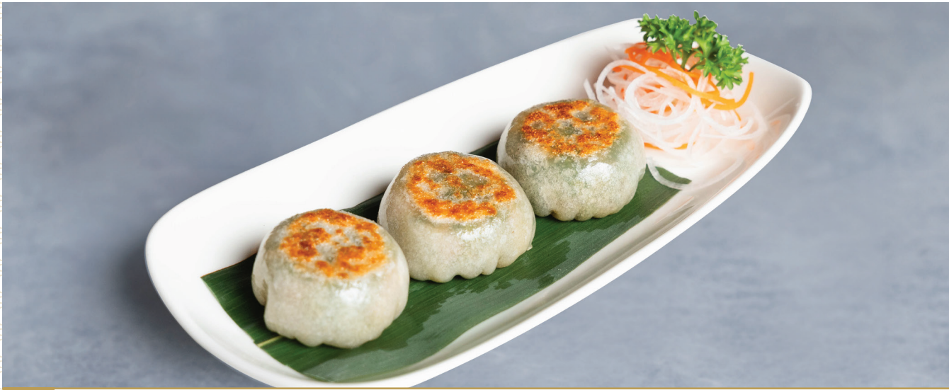
CS9 នំគូតាយចៀន 香煎韭菜粿 Pan Fried Chives Dumpling $4.80 / 例