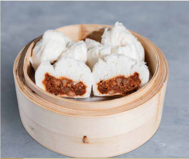
CS4 នំប៉ាវសាស៊ីវ 蚝皇叉烧包 BBQ Pork Bun $4.80 / 例