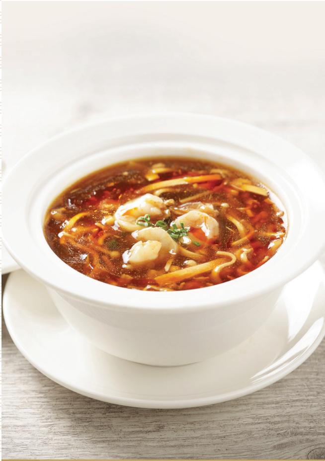
C2 ស៊ុបធូរហិរគ្រឿងសមុទ្រ 海鲜酸辣汤 Seafood Hot and Sour Soup $6.80 / 位