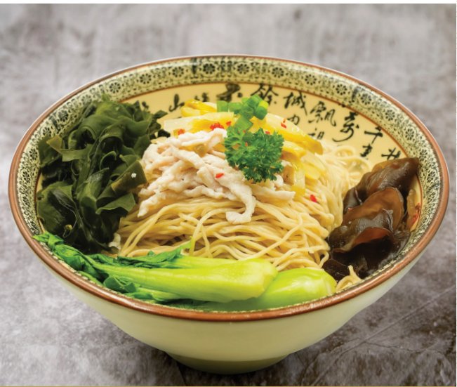
H8 ស៊ីបមីឡាម៉ៀនសាច់ជ្រូកសសៃនិងបន្លែស៊ីលឺន 榨菜肉丝拉面 La Mian in Shredded Pork and Mustard in Signature Pork Bone Soup $7.80 / 例