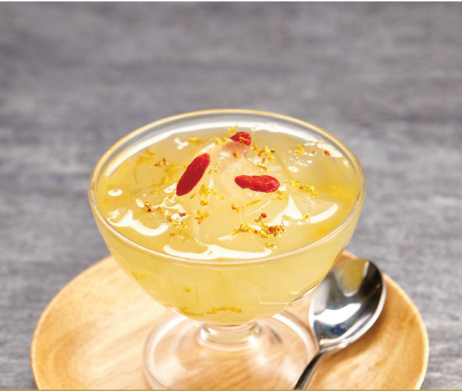
J8 ទឹកបន្លាស់កន្ទុយក្រពើជាមួយតែតូយហ្វា 柠檬芦荟桂花蜜 Chilled Aloe Vera with Osmanthus in Honey Lemon Juice $3.80 / 位