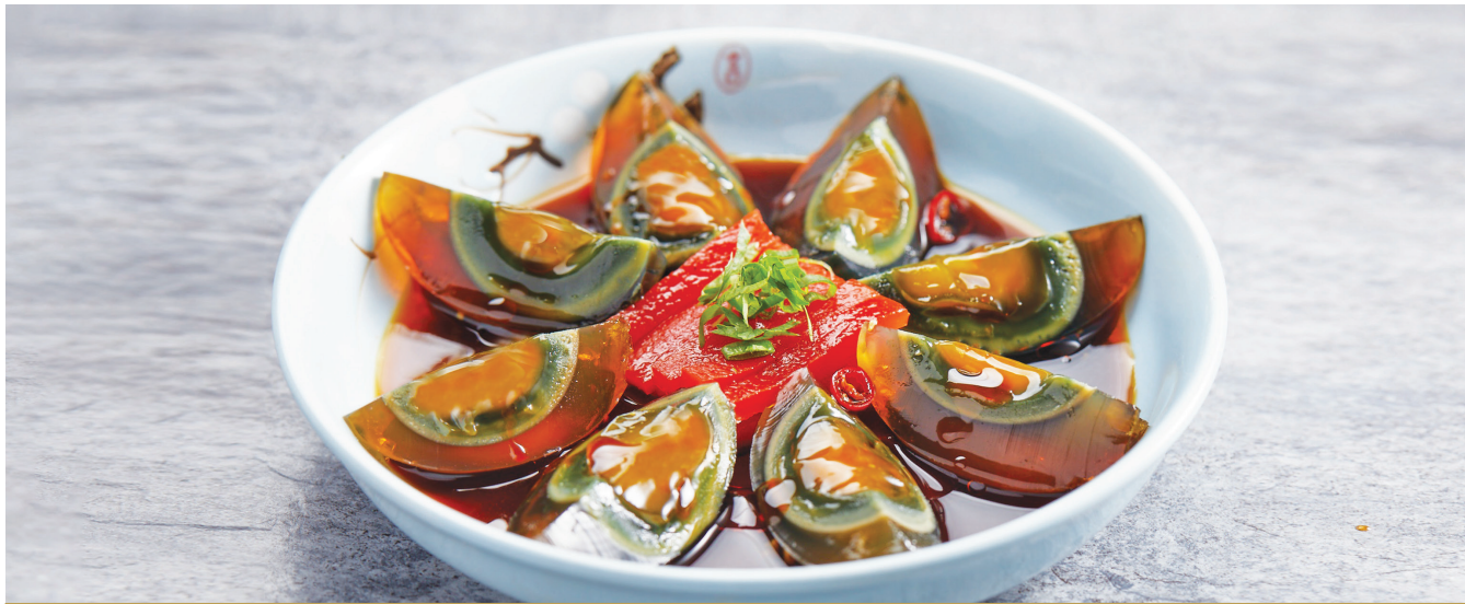
D9 ស៊ុតខ្មៅជាមួយប្រេងម្ទេស 烧椒皮蛋 Century Egg with Vinaigrette and Chilli Oil $4.80 / 例