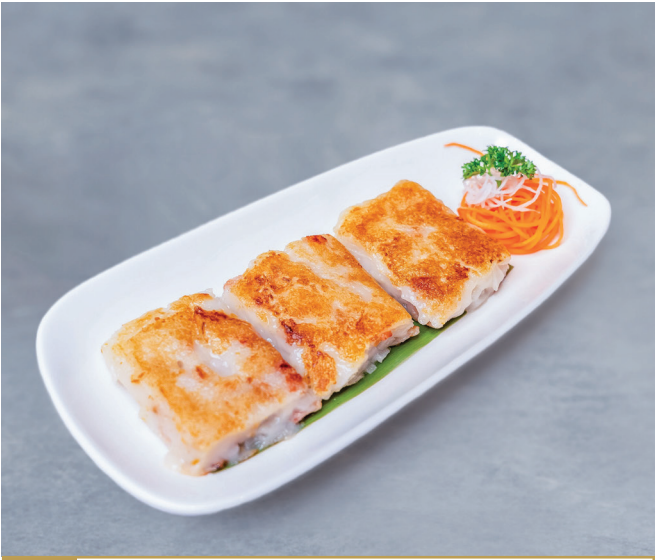
CS12 នំតែថាវចៀន 香煎萝卜糕 Pan fried Turnip cake 🍴 $3.80 / 例